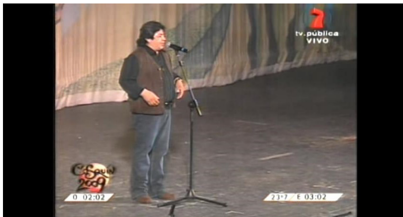
Modelo chileno 1. (Disponible en: https://www.youtube.com/watch?v=nJ-d0NCqbj.s .)

¿Vamos a ver unos informantes de Santiago de Chile hablando? Haz atención al modo como hablan llevando en cuenta las características fónicas que viste en el apartado anterior.