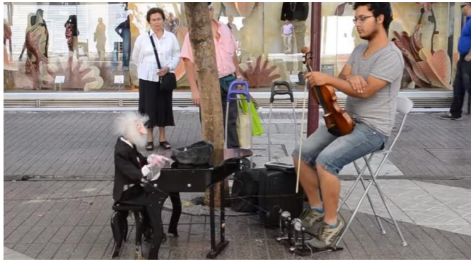
Santiago de Chile. (Disponible en: https://www.youtube.com/watch?v=11Ni7490jno .)

Ahora que ya sabes un poco más sobre la capital que nos servirá de modelo de habla, vamos a pasear un poco por ella asistiendo el videos disponible en el Ambiente Virtual de Aprendizaje (AVA):