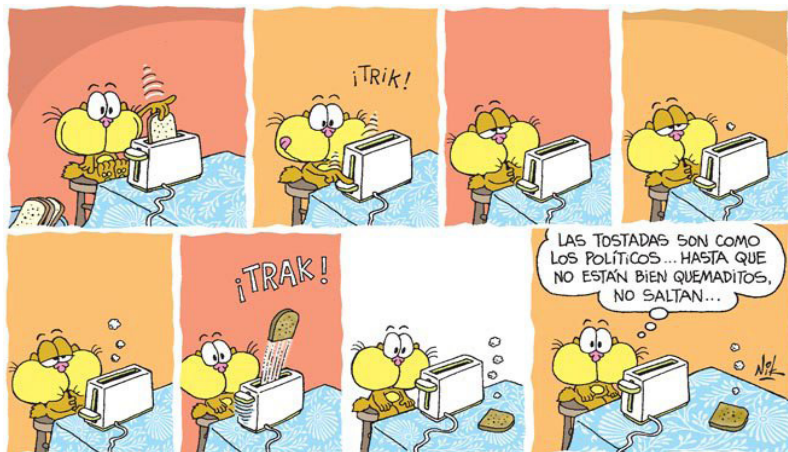
Legenda: ejemplo de onomatopeya 1 https://truquitosdemundogaturro.files.wordpress.com/2011/02/183602_10150095547771304_333723386303_6339953_158309_n.jpg