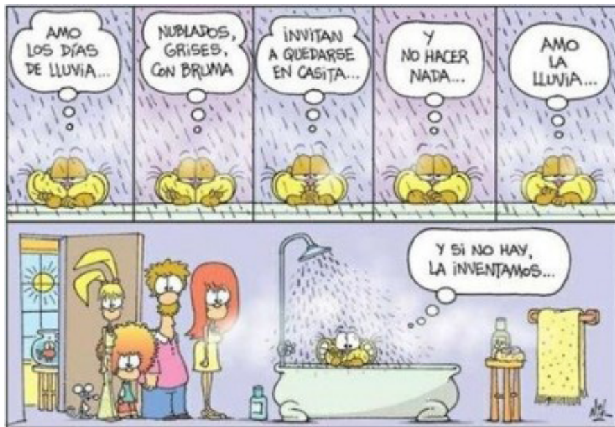
Legenda: ejemplo de dibujo colorido https://eridasouza2.files.wordpress.com/2014/06/1527071_10151854874386304_1534062218_n-e1403214487639.jpg