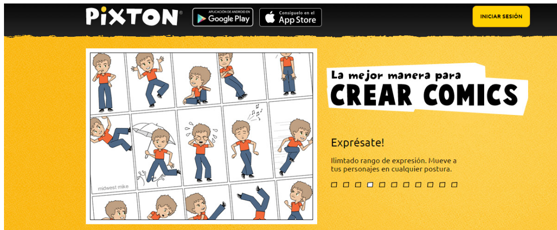
Legenda: site Pixton

Para la elaboración de la historieta digital, sugerimos el sitio Pixton , disponible en el enlace http://www.pixton.com/es/ :