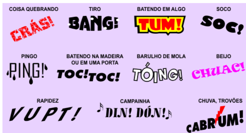
Legenda : ejemplo de onomatopeya 2 http://4.bp.blogspot.com/-WjiXQC5Bhro/UHI9k6UJPD1/AAAAAAAAATQ/MxTEN5sXBqk/s1600/onomatopeia.gif