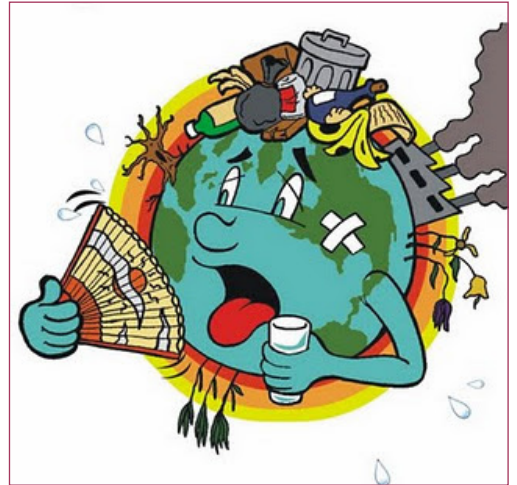
Legenda: imagen ilustrativa de los problemas ambientales 2 http://gestaoambientalufsm.blogspot.com.br/2012/12/problemas-sociais-e-ambientais-das.html