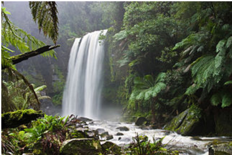
Legenda: ejemplo de naturaleza 2