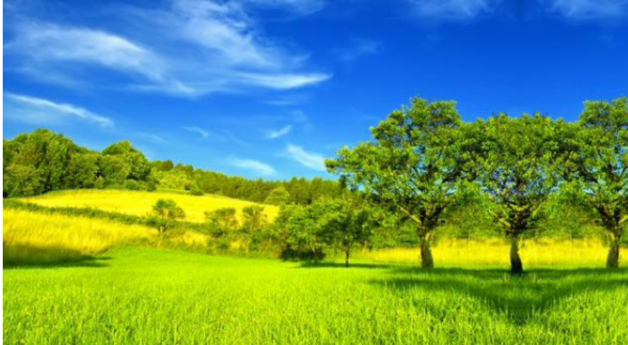
Legenda: ejemplo de naturaleza 1 http://static2.elblogverde.com/wp-content/uploads/2013/04/amenazas-del-medio-ambiente-600x329.jpg