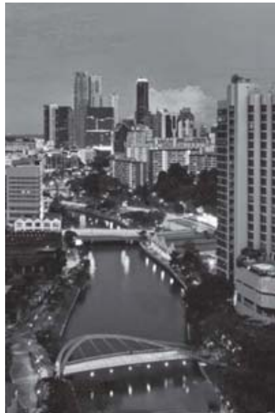
A construção de novas cidades pela Housing Development Board de Cingapura é um exemplo de urbanização planejada.

Ter estudado as características do modo de produção capitalista industrial, e as transformações que ocorreram, nesta fase, em relação ao desenvolvimento técnico, científico, territorial, como também, nas relações sociais, na urbanização das cidades e no aumento do número das metrópoles mundiais.