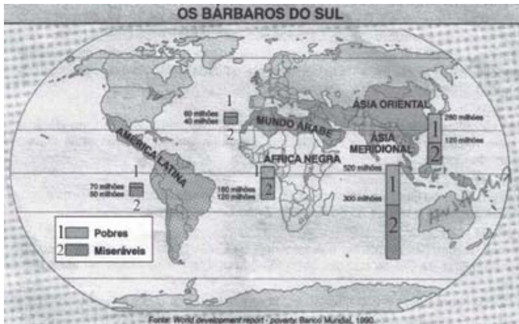
O mapa mundi: “Os bárbaros do Sul.

Esses países subdesenvolvidos procuravam também, de maneira incessante, os bancos das nações desenvolvidas, em busca de empréstimos, para tentar solucionar as crises econômicas internas, que se vinham avolumando desde a sua independência política. As concessões feitas através de empréstimos e doações, pelos grupos dos países ricos, aprofundaram a dependência e a crise econômica dos países “pobres”, em vez de melhorar as suas condições financeiras. Isto ocorreu porque os países desenvolvidos não estão preocupados, na verdade, em resolver as crises dos países pobres, mas pelo contrário, esses países financiadores aprofundam a miséria e as desigualdades das nações periféricas e subdesenvolvidas. Organizam-se em grupos de empresas que promovem e alcançam o controle da produção, dos mercados e das vendas dos produtos no mundo todo. Com isto, o capitalismo industrial, agora monopolista e internacional, que é formado pela articulação entre as potências, fez surgir mais uma forma de aprofundar o domínio do mercado internacional, controlando o que se produz, onde e quando se produz e para quem se produz. Desta maneira, foram sendo estruturados cartéis, trustes e “holding”, que foram novas maneiras criadas pelos capitalistas, para explorar mais ainda as ex-colônias e até países que alcançaram a sua independência política, como foi o caso do Brasil, que proclamou a sua República no final do século XIX (1889).