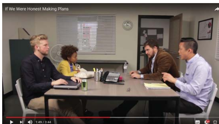
If We Were Honest Making Plans . Fonte: https://www.youtube.com

DICA: Ao assistir o vídeo, você pode clicar no primeiro botão na parte inferior da tela, ao lado direito, para ativar as legendas em inglês!