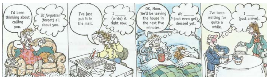
Aspect exercises.