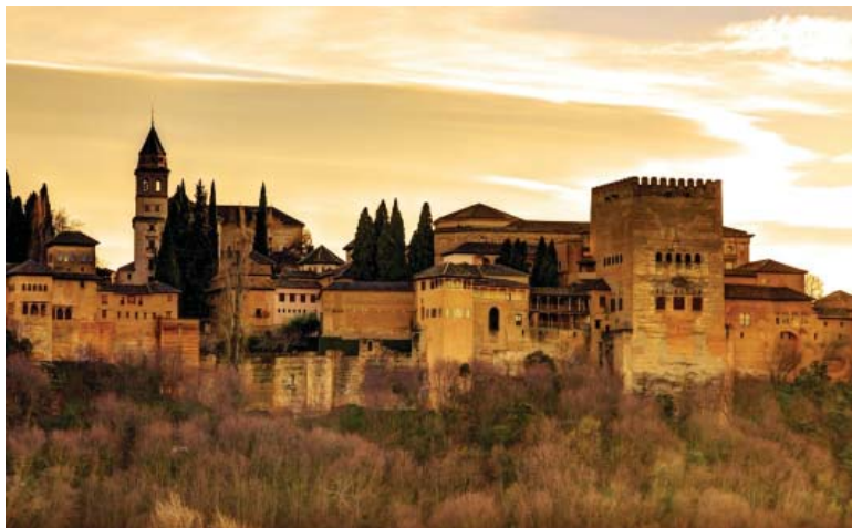
Palácio e fortaleza de Alambra. Disponible en: http://www.historia-espana.com/ >. Acceso em: 30 set. 2016.

En las crónicas árabes nos encontramos muy a menudo con la noticia de una alianza de Granada con el reino de Castilla para impedir la invasión de los benimerines, para luego, dos o tres páginas más adelante, sorprendernos con otra noticia que anuncia la firma de un pacto del califa magrebí benimerín con los castellanos para socavar la influencia de los granadinos en alguna ciudad costera de lo que quedaba de Al-Andalus. Para los historiadores, es justamente esta profusión de alianzas, pactos y traiciones la que permitió a Granada sobrevivir durante dos siglos. Los nazaríes se mantuvieron en el poder más tiempo que los almorávides o los almohades, potentísimas dinastías cuyos ejércitos no tenían adversarios merecedores de sus espadas.