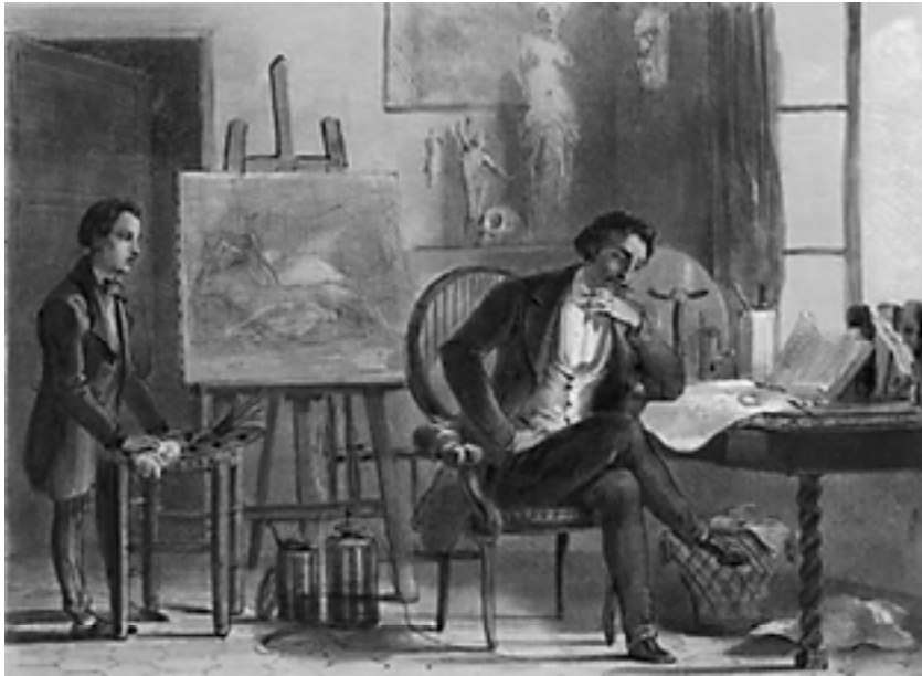
SAMUEL MORSE (1791 – 1872) artista americano e inventor do telégrafo elétrico.

Assim, além de proporcionar incremento do intercâmbio intelectual, o livro tornou-se um produto comercial, um verdadeiro “meio de poder ao serviço do Ocidente”, segundo opinião de Fernand Braudel. (1995, p. 366).