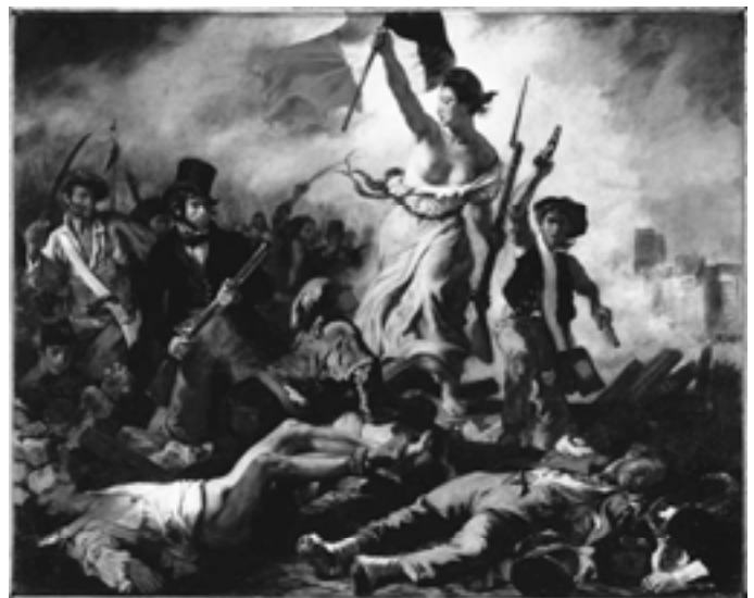
A Liberdade conduzindo o povo - Eugène Delacroix, 1830 (Fonte: Musée du Louvre, Paris).

A partir da invenção do telégrafo, justamente durante o período da Revolução Francesa, em 1793, e da criação do telégrafo elétrico, em 1850, a imprensa consolidou seu poder de influenciar as pessoas por meio da capacidade de noticiar os acontecimentos internacionais atualizados. O poder alcançado pelos jornais foi tamanho que, ainda no século XIX, considerando a influência dos jornalistas britânicos diante das três tradicionais forças políticas da nação – clero, nobreza e povo – os mesmos foram chamados de “quarto poder”.