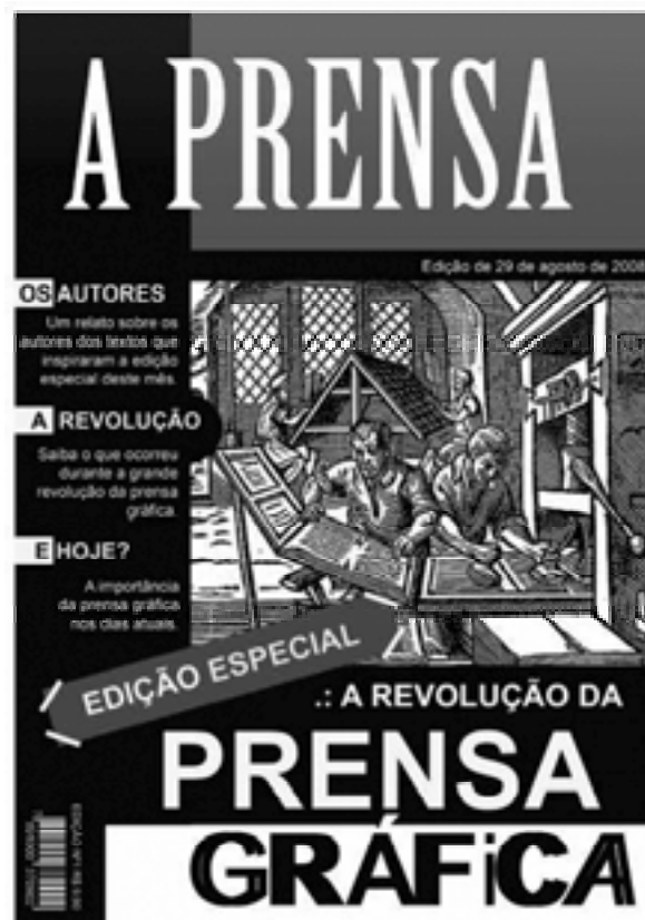
A revolução da prensa gráfica seminário. Edição de 29 de agosto de 2008.

Para aproveitar melhor esta aula, você precisa compreender o conceito de modernidade.