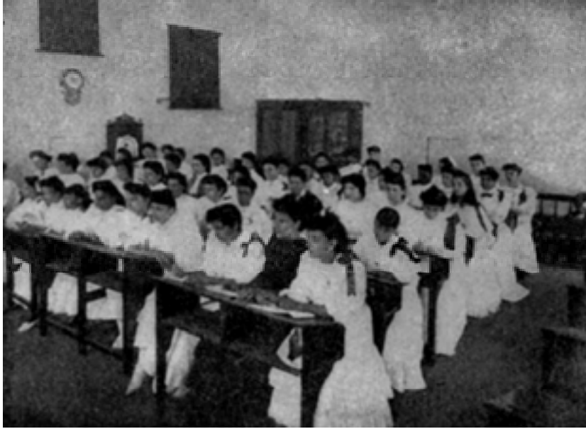
Fotografia de sala de aula feminina que ilustra o livro Histórias da nossa terra , de Julia Lopes de Almeida, publicado em 1907.

vel pela organização da vida doméstica nos primeiros tempos da colonização. Por sua vez, Gilberto Freyre detalha as contribuições da cultura indígena transmitidas pela cunhã, desde o asseio pessoal, diversos alimentos, a rede de dormir, o óleo de coco para os cabelos, até animais domésticos.