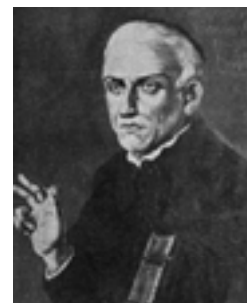
José de Anchieta

Como lazer, restava o banho de rio e algumas brincadeiras ensinadas pelos jesuítas. Cultivava-se a música, o canto e a dança. Instrumentos musicais foram trazidos da metrópole para a encenação de espetáculos, procissões e ladainhas. O objetivo era cooptar as crianças.