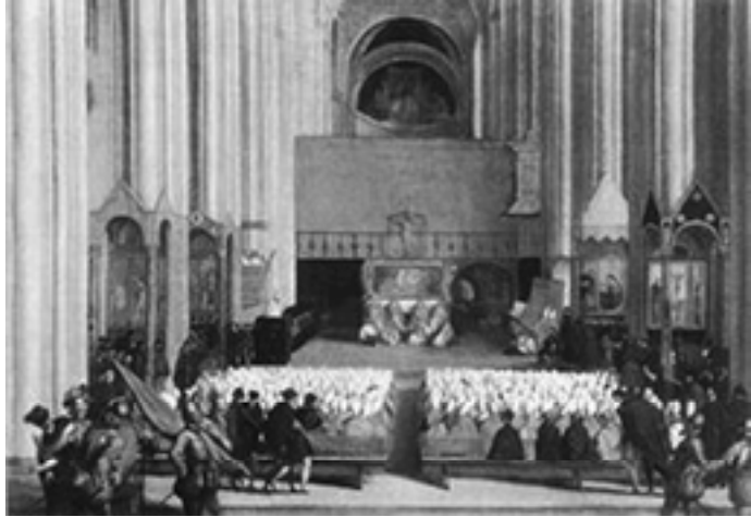
Sessão do Concílio de Trento.

Já lhe apresentei, na aula anterior, o porquê da preferência dos