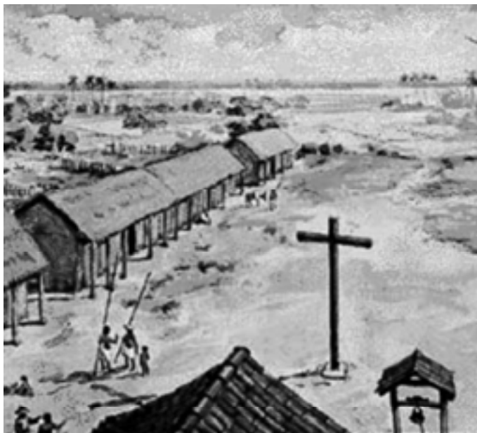
Aldeia Missionária - século XVII