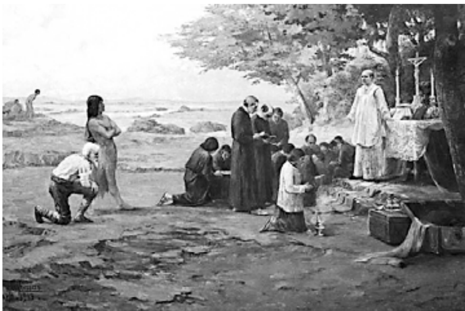
Jesuítas catequizando os Índios.

Pois então, companheiro(a), vamos agora apresentar a educação na terra tupiniquim! Vou tomar como marco inicial o processo de colonização portuguesa. Portanto, não vou tratar da educação na sociedade indígena, nem entre os negros na África, antes da intervenção violenta do branco europeu sobre esses dois povos. Escolho o processo que irá desembocar na educação formal, conforme vimos suas origens nos tempos modernos.