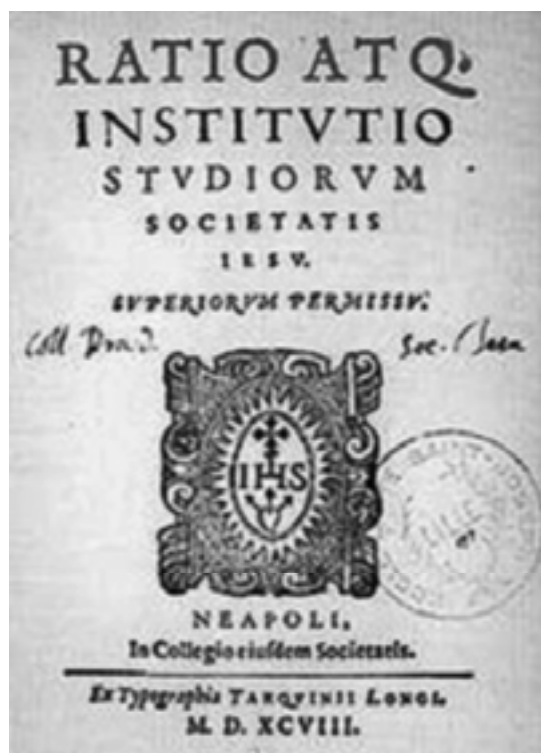
Ratio Studiorum , 1598.

A Companhia de Jesus tomou como modelo de sua pedagogia os ginásios protestantes e, sob influência humanista, incorporou ao currículo a literatura clássica. O método pedagógico utilizado pelos jesuítas foi uma detalhada elaboração produzida pelo Geral da Ordem, Claudio Acquaviva, em 1599, chamado de Ratio Studiorum . Nesse documento, estão prescritas que práticas educacionais deveriam ser adotadas, o currículo dos cursos, como deveria ser a administração dos