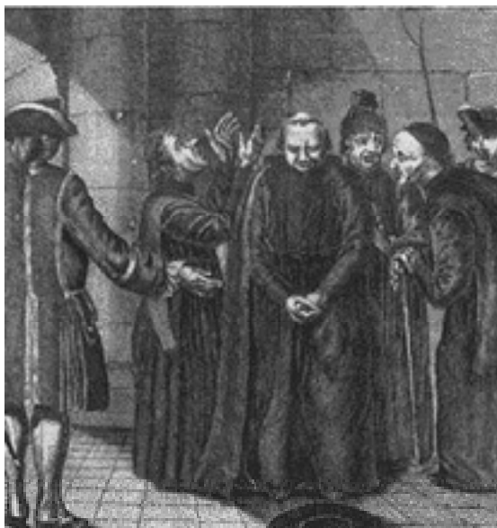
Gravura que satiriza o desamparo dos jesuítas ao serem expulsos da colônia.

Por mais que fosse conservadora e influenciada pela mentalidade católica retrógrada, a sociedade portuguesa não poderia ficar imune às influências do movimento histórico por que passou a Europa Ocidental a partir do século XVI. Predominava na Península Ibérica um “modelo tridentino – jesuítico – inquisitorial”, enquanto as “nações polidas da Europa” já vivenciavam a influência da ciência newtoniana, do racionalismo e do empirismo filosófico.