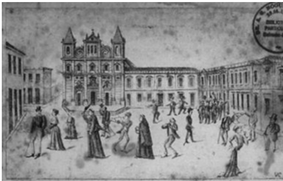
O largo do Terreiro de Jesus, onde ficava a Escola de Cirurgia da Bahia, retratada por autor desconhecido, entre o fim do séc. XIX e o início do sec. XX. Coleção de Joaquim Teixeira Lopes. (Fonte: http://www.revistadehistoria.com.br ).

As chamadas “aulas régias” convertiam a escola em uma “unidade de ensino com um professor”, Cardoso (2004, p. 187). Em contraposição ao ensino religioso, “aulas régias” significavam as aulas que pertenciam ao “Estado”. Eram cadeiras avulsas de ensino das humanidades. Por meio de concursos públicos, escolhiam-se os professores régios das diversas disciplinas que ministravam as aulas em suas próprias casas. Em 1772, foi criado um imposto chamado de “subsídio literário” para financiar os estudos menores. O sistema só começou a funcionar, no Rio de Janeiro, em 28 de junho de 1774, com a instalação da Aula de Filosofia Racional e Moral. A previsão da legislação portuguesa era de 44 professores régios para a colônia brasileira, assim distribuídos por disciplinas: aulas régias de Primeiras Letras (17 professores); Aula Régia de Latim (15 professores); Aula Régia de Grego (3 professores); Aula Régia de Retórica (6 professores) e Aula Régia de Filosofia (3 professores). O maior número de cadeiras era para Pernambuco, com onze cadeiras, depois a Bahia, com dez e em terceiro lugar, o Rio de Janeiro, com sete aulas régias, Cardoso (2004, p. 186).