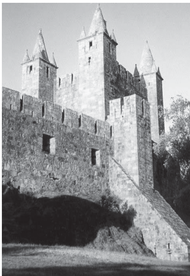
Castelo originário do sec. X. Santa Maria da Feira, Portugal.

Conhecimento sobre as invasões bárbaras, contatos lingüísticos e a afirmação dos diferentes romances hispânicos.