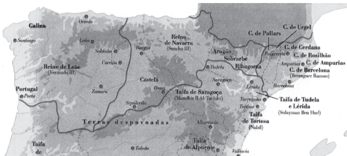
Detalhe do mapa da Península Ibérica no período da ocupação árabe.