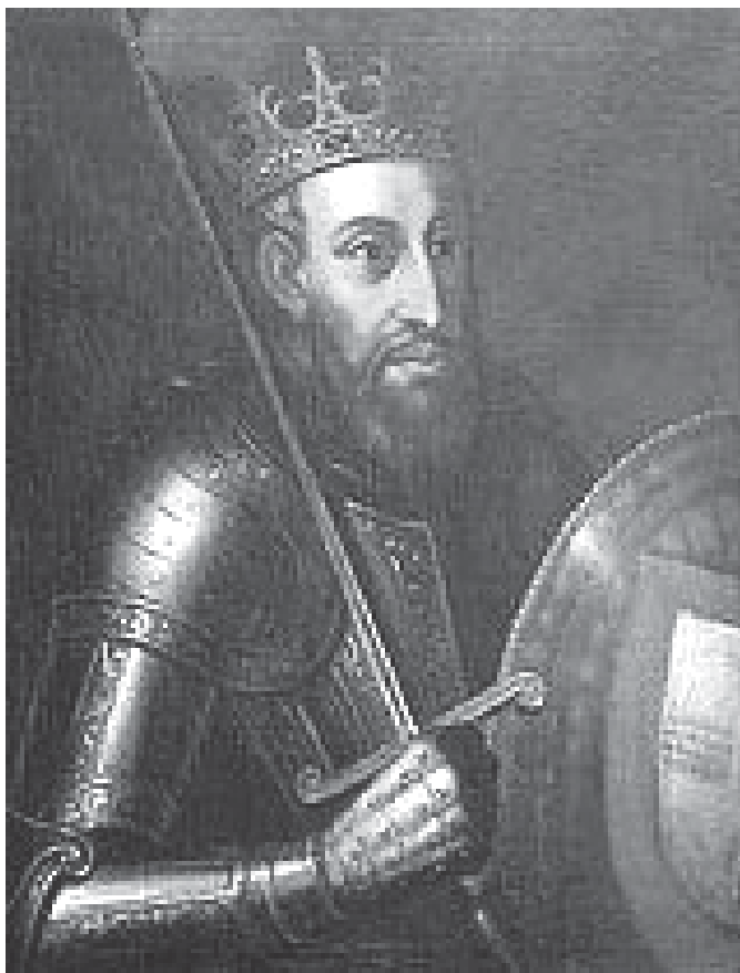
D. Afonso Henriques.

Conhecimento sobre o legado cultural e lingüístico dos árabes na Península Ibérica.