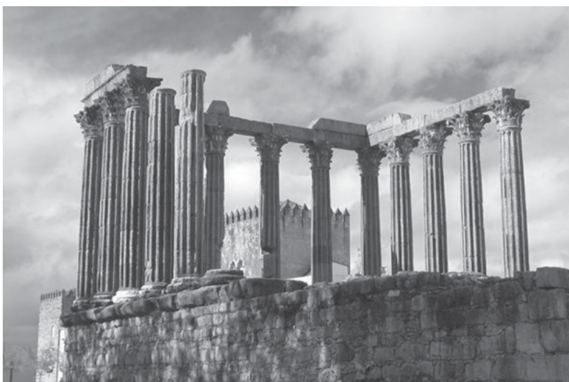
Templo de Diana, em Évora, Portugal.

Desse processo de autonomia, a influência francesa (via a cultura aristocrática e clerical), os novos contatos com árabes e moçárabes contribuem para renovar hábitos culturais e lingüísticos, a emigração de camponeses para as cidades da Estremadura e do Alentejo , as modificações da corte régia face à progressiva extensão e complexidade dos novos domínios políticos, as diversas fases de enfrentamento com os árabes, a influência da cultura literária provençal são alguns dos marcos que agem, de maneira lenta, mas profunda, na formação lingüístico-cultural de Portugal, entre os séculos XI e XIV.