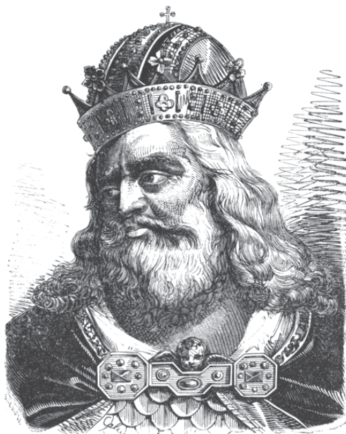
Imperador Carlo Magno.

Rei dos francos (768-814). Grande figura lendária e histórica, da Idade Média francesa, criador do Império Carolíngio que faz florescer a arte, a arquitetura, a literatura e um novo tipo de escrita (carolíngia) medieval.