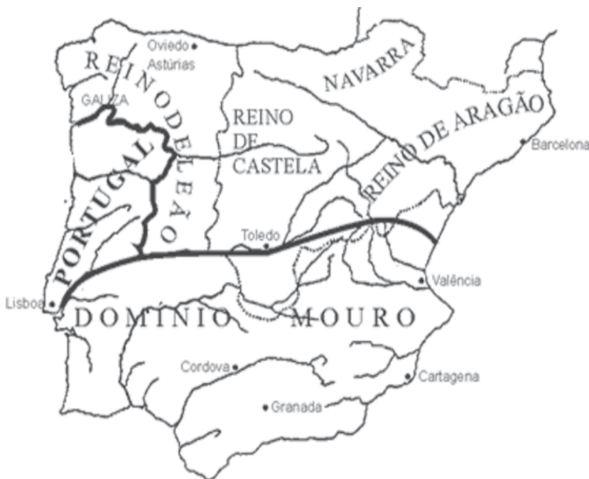
Mapa do Condado Portucalense.

Retomando, ainda, a situação das terras da Galiza (isto é, do noroeste