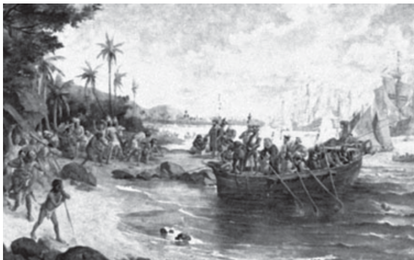
Desembarque de Cabral no Porto Seguro - Oscar Pereira da Silva - Museu Paulista - SP.

Período pré-histórico ou proto-histórico identificado com o estágio de civilização em que se encontravam os indígenas habitantes das terras do Brasil, em 1500.