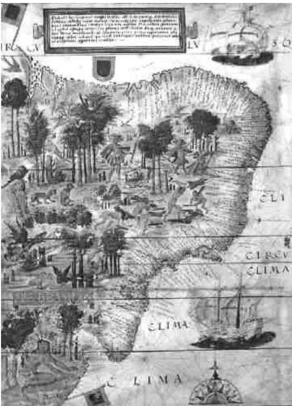
Mapa da extração de pau-brasil

No entanto, haveria de caber ao colonizador europeu (o português), em virtude de sua superior condição técnica, seu poder bélico (militar), suas estratégias avançadas de dominação política, seu uso e manejo de armas poderosas para a época, o abuso da força bruta e da violência e seu elevado estágio intelectual, ter a pos-