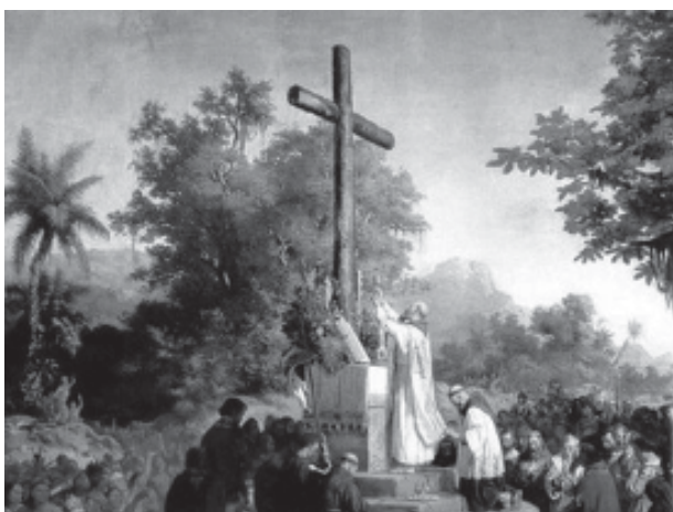
Primeira missa no Brasil - Victor Meirelles 1860 - Museu Oscar Niemeyer – Curitiba –PR.

A aula número 12 – A projeção da língua portuguesa no Novo Mundo: aspectos lingüísticos e culturais.