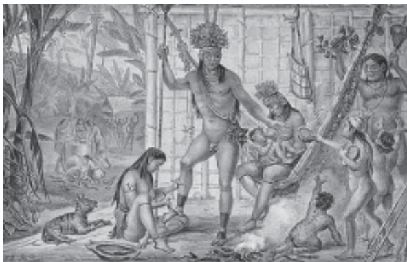
Povos indígenas brasileiros.

Modalidade de língua indígena da costa brasileira, espécie de língua franca ou um tipo moderno de origem tupi, usada para fins de comunicação e/ou catequese. Os missionários jesuítas normalizaram e disciplinaram o “nheengatu” e passaram a chamar de língua geral. Nativa, indígena, “nheengatu” significava a língua boa, isto é, veículo de comunicação facilitado entre as duas culturas em contato: a indígena e a portuguesa.