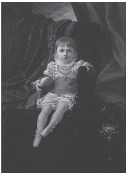
Dom João IV - Pedro Américo (Fonte: www.bndes.gov.br ).

Ao final desta aula, o aluno deverá: determinar historicamente as idéias renovadoras que deram origem ao movimento romântico do século XIX; estabelecer as características culturais e lingüísticas do Brasil nas três primeiras décadas do século XIX; reconhecer o movimento intelectual e literário do Brasil e seus reflexos na questão lingüística do português brasileiro.