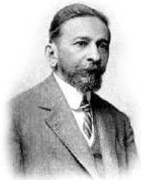
José Veríssimo.

te; b) presença mais constante de tempos verbais compostos, à moda francesa ou italiana; c) uso extremo e até abusiva liberdade ao colocar os pronomes átonos; d) maior extensão de uso a certas preposições; e) emprego de vocábulos ameríndios e africanos já consagrados pelo falar do povo; f) uso insignificante de estrangeirismos léxicos ou sintáticos; g) aceitação plena das alterações semânticas operadas pela fala popular.