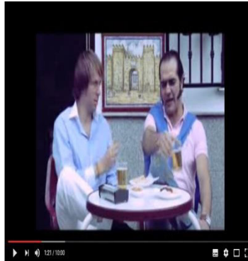
Modelo Sevilla. (Disponible en el AVA: https://www.youtube.com/watch?v=BK7BscDX7D4 )