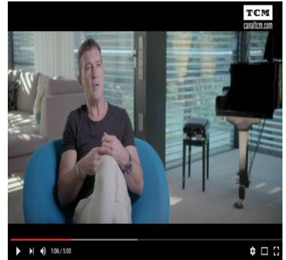
Modelo Málaga. (Disponible en el AVA: https://www.youtube.com/watch?v=hkms_9hoI5w )