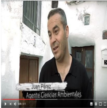
Modelo Granada. (Disponible en el AVA: https://www.youtube.com/watch?v=8EYYaj1vsDs )