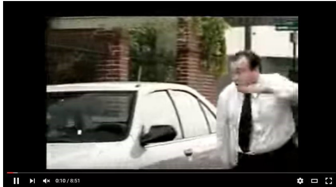
Modelo de Lima. (Disponible em el AVA: https://www.youtube.com/watch?v=IvC6NGO6PN0 )