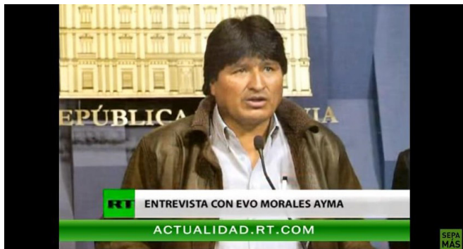
Modelo de La Paz. (Disponible em el AVA: https://www.youtube.com/watch?v=FopjVEfYP_I )