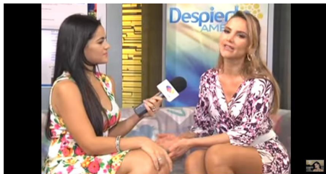
Modelo de Bogotá. (Disponible em el AVA: https://www.youtube.com/watch?v=hrZ8TGpu4gM )