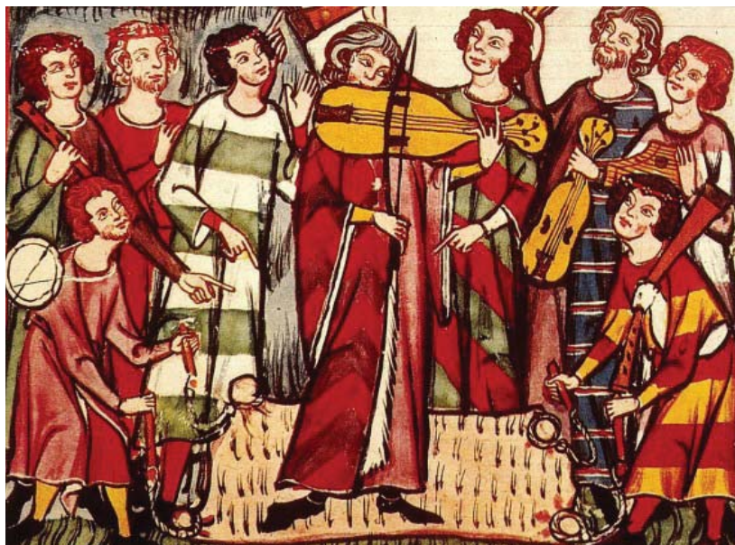
El juglar.

Estas personas ganaban sus vidas divirtiendo a las gentes, en las plazas públicas o en los palacios de los nobles. Tenían libertad de poetizar a la realidad, recitando versos que aprendieron de memoria, canciones o largas relaciones de hechos y sucesos, casi siempre históricos, que interesaban al pueblo. Los poemas se denominaban cantares de gesta y muchas veces, se acompañaban con instrumentos musicales de cuerda y de percusión. Se supone que no fueron creadores, sino meros repetidores de composiciones ajenas. Los juglares daban a conocer los cantares de gesta de forma oral. Sin embargo, hay un poema épico 1 , considerado el primer monumento literario en lengua española que ha llegado hasta nosotros gracias a un manuscrito fruto de un juglar.