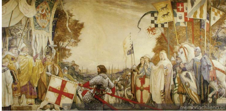
Bendición de las Banderas de El Cid de Pedro Subercaseaux Errázuriz.

Se convirtió en leyenda cuando los juglares empezaron a cantar sus gestas trayendo noticias de aquellos sucesos históricos.