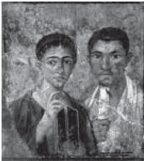
Afresco representando cidadãos de Pompéia. (Fonte: http://berlinghieri.spaces.live.com ).