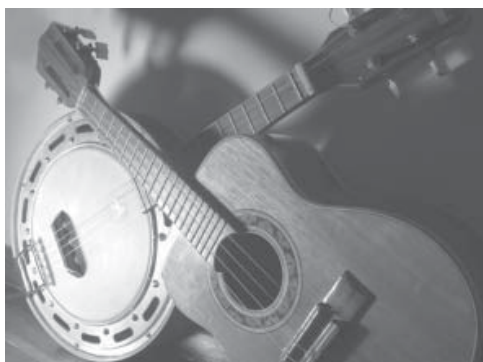
O Samba do Rio de Janeiro é considerado patrimônio cultural do Brasil.

As realizações, frutos da atividade e da criatividade humanas, distinguem as sociedades umas das outras, dando o sentido de identidade local e/ou nacional.