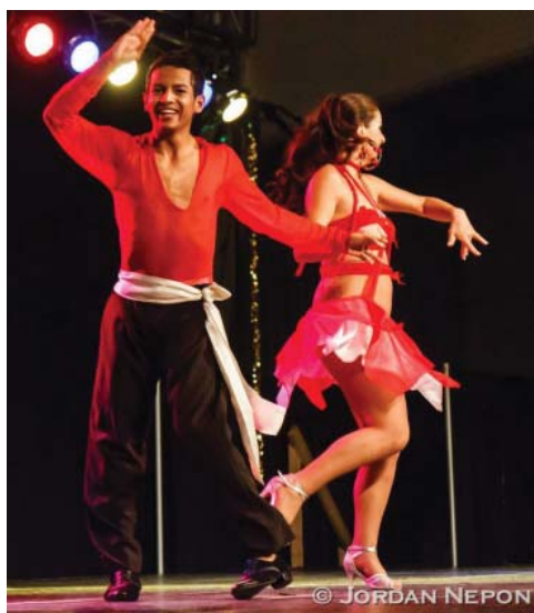
La salsa.

Sin embargo, en los ochenta nace un subgénero llamado “salsa romántica”, caracterizado por melodías lentas y letras de amor. La salsa va dejando los sonidos fuertes y las descargas furiosas para entrar en un sonido más cadencioso, que posibilitaba un baile más lento. Por otra parte, en los noventa resurge la “salsa dura”, en contraposición con la anterior, y otros ritmos caribeños como el merengue dominicano y la bachata . Destacamos figuras como: Eddie Santiago, Frankie Ruíz o Rubén Blades.