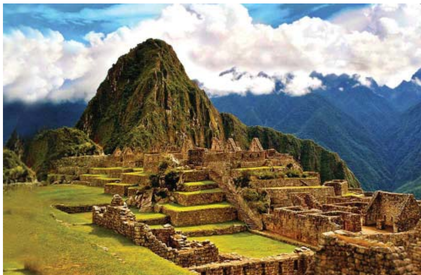
Machu Picchu.

El arte azteca se caracteriza por la motivación religiosa de sus expresiones artísticas. En honor a los dioses levantaron numerosos templos como, por ejemplo, el Templo Mayor (Huateocalli) en Tenochtitlán , en la cima de estas pirámides se alzaban altares para realizar sacrificios humanos en honor a estos dioses. La escultura y la pintura azteca también guardaban relación con su religión y cosmología. Era muy simbólica, con temas mitológicos y figuras antropomorfas y zoomorfas alusivas a divinidades. Así, por ejemplo, tenemos La Piedra del Sol , un calendario símbolo de la divinidad solar o esculturas como la de la diosa Tlazoltéotl alumbrando a Centeotl , esculturas que decoraban las fachadas de bajorrelieves.