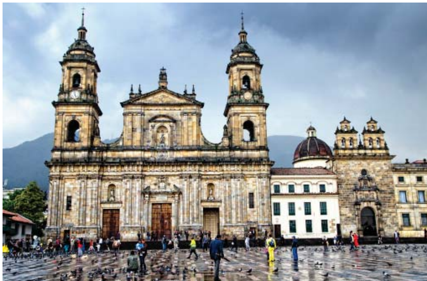
Catedral de Bogotá . Disponible en: https://www.flickr.com

EL plateresco (estilo arquitectónico renacentista español del siglo XV) se utilizó en la construcción de la Catedral de Santo Domingo (1523), de interior gótico. La Catedral de Puerto Rico (1555) y la iglesia mexicana de San Agustín de Acolmán poseen restos de este estilo.