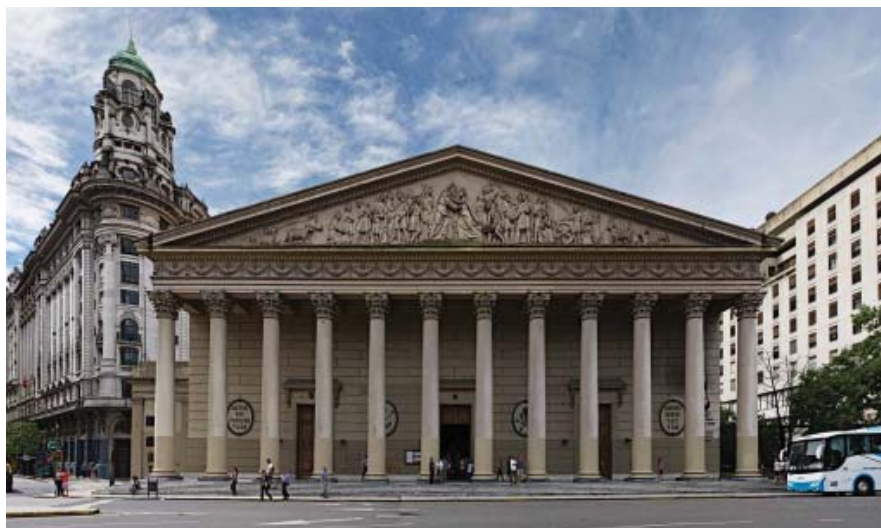
Catedral de Buenos Aires.

En este período, el estilo barroco se mantuvo en las zonas rurales, mientras que en las urbanas el neoclasicismo se impuso como arte oficial hasta finales del siglo XIX. Destacamos tanto edificios civiles como templos: El Palacio de La Moneda en Santiago de Chile y las Catedrales de Buenos Aires , Santiago de Cuba , Montevideo o Bogotá . También es de esta época el cultivo de una arquitectura historicista que sembró el continente el edificio de edificios neogóticos, neobarrocos, neocoloniales. La pintura en esta época romántica se caracterizó por su temática histórica y costumbrista. El paisaje y el retrato fueron los géneros más cultivados. El histórico sirvió de instrumento para la afirmación nacional: los retratos de Bolívar, de San Martín o de O'Higgins son buenas muestras de ello. La escultura se sometió al servicio del urbanismo y de la exaltación patriótica, como en la pintura. Son características las esculturas de los nuevos próceres del Estado, los túmulos funerarios, los conjuntos conmemorativos y alusivos a las glorias de la nación. Así por ejemplo, tenemos el Monumento a Cuauhtémoc (México) y a José Martí (la Habana); o El Paso de Los Andes por el general San Martín (Mendoza).