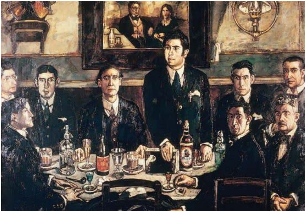
Imagem 2. Grupo de los Tres.

La campaña política de los Tres estuvo marcada por el fracaso, lo cual condujo a un hondo desengaño. En esto les había precedido Unamuno, que había negado su apoyo al grupo de los Tres por su pérdida de interés por temas económicos y sociales. Ahora aspira sólo a modificar la mentalidad del pueblo. En 1905 los Tres abandonan el camino de la acción e inician un giro hacia posturas idealistas. Siguen sintiendo la preocupación por España pero desde un escepticismo desconsolado o desde la actitud contemplativa de un soñador.