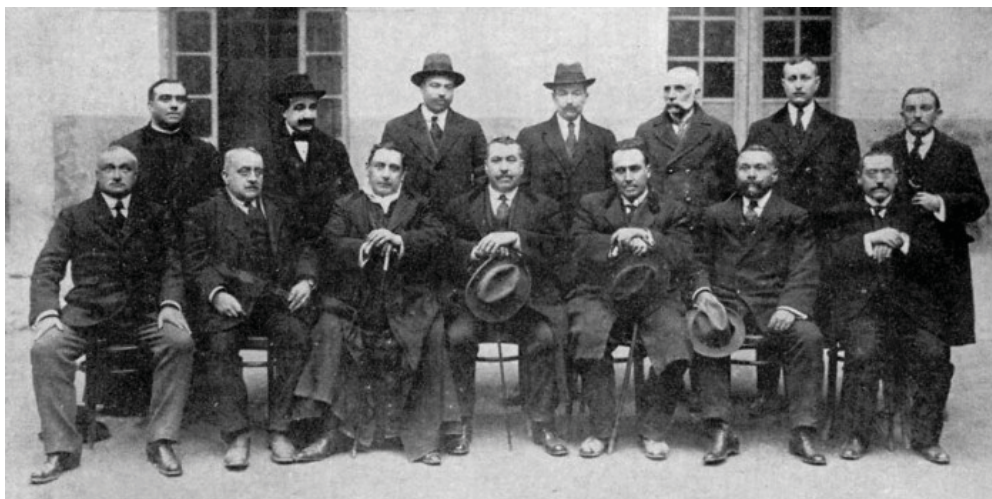
Imagen 1. La generación del 98 (Disponible: https://www.caracteristicas.co ).