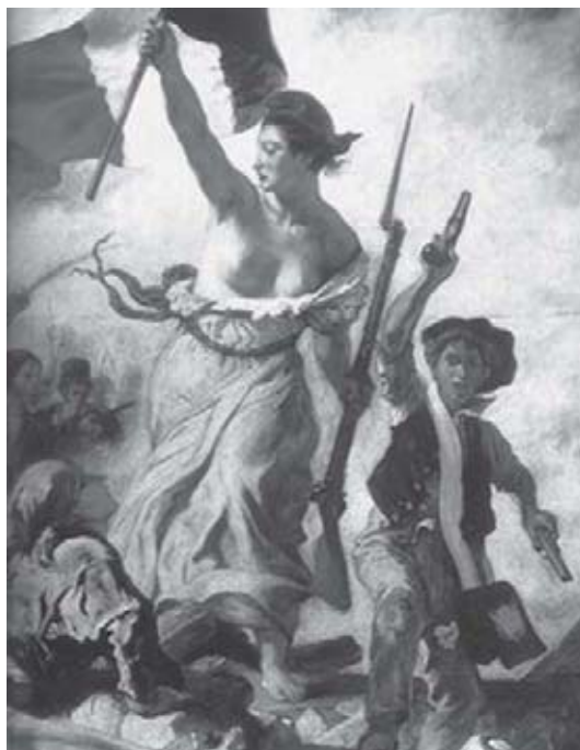
Figura 1 - Detalhe do quadro A liberdade guiando o povo , de Delacroix.

Ao final desta aula, o aluno deverá: identificar as fontes do pensamento de oposição ao mercantilismo e ao absolutismo; reconhecer que a transformação econômica ocorrida nos séculos XVI, XVII e XVIII foi acompanhada por mudanças no conhecimento e na ideologia; relacionar os princípios básicos do renascimento e do iluminismo que forneceram elementos para o pensamento liberal clássico; conceituar o liberalismo; relacionar a ideologia liberal com as transformações econômicas ocorridas no século XVII.