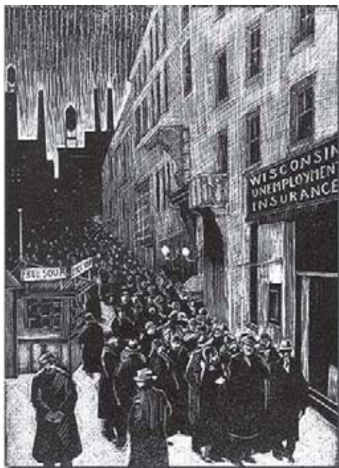
Figura 6 - Ilustração representando o desemprego.

Mas todos os três modelos de regulação têm os mesmos objetivos: controlar o tempo do trabalhador, organizar o processo de produção visando alcançar maior produtividade e maior acumulação de capital. Também, as regulamentações impostas aos trabalhadores, além de buscar a produtividade, implicavam em ações que fragmentavam a classe trabalhadora, quebrando o seu poder de luta.