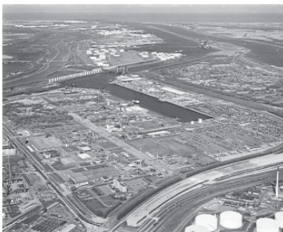
Figura 1 - Foto aérea do Porto de Rotterdam, na Holanda..

Ao final desta aula, o aluno deverá: apreender as relações constitutivas do modo de produção capitalista; identificar as fases do desenvolvimento capitalista. Reconhecer as características do capitalismo concorrencial ou liberal; reconhecer o gerenciamento científico como instrumento de controle do capital sobre o trabalho; identificar os elementos que contribuíram para a formação do capitalismo monopolista.