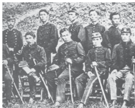
Figuras 2, 3 - Imperador Meiji Mutsuhito com Soldados armados do império Meiji. A Era Meiji (1868-1912) promoveu reformas econômicas que eliminaram as características feudais do Japão (reforma agrária, liberação da mão-de-obra e assimilação da tecnologia ocidental), modernizando o país e preparando-o para ingressar no capitalismo. As mudanças foram empreendidas pela força do dinheiro e das armas e contaram com a associação de grandes capitalistas internacionais.