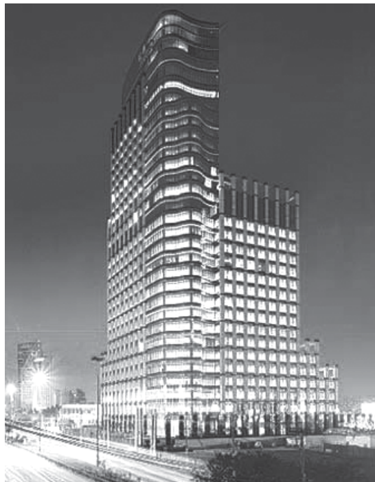
Figura 5 - Sede brasileira do Bank Boston, em São Paulo.

(material produzido destinado a ser vendido no mercado, logo não se destina a ser consumido pelo produtor), que possuem valor de uso (mercadoria que satisfaz as necessidades humanas) e valor de troca (mercadoria destinada a ser trocada por outra no mercado. Cada mercadoria possui o seu valor de troca).