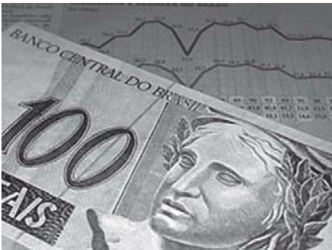
Figura 4 - Nota de Cem Reais.

As afirmações de Peliano, citadas acima, dirigem para a necessidade de se ter clareza do que seja “capital”, elemento chave do modo de produção capitalista. Por capital, geralmente, se entende como uma riqueza ou dinheiro, porém, quando usamos o termo no contexto histórico capitalista, o significado do “capital” assume, não só o significado de “riqueza acumulada”, mas