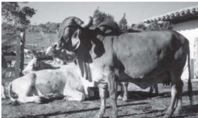
Figura 2 - Gado Bovino