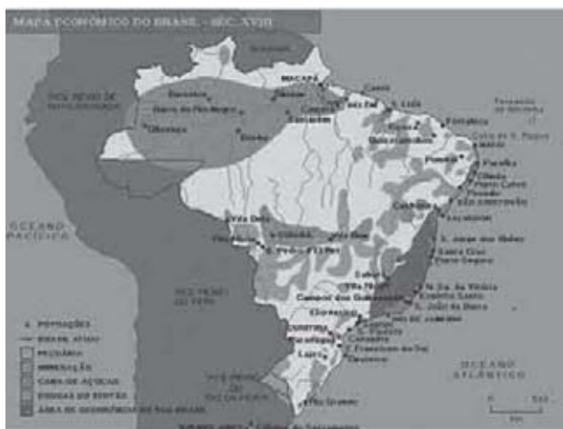
Figura 10 - Mapa Econômico do Brasil Século XVIII.

Através do Tratado de Methuen. Portugal abria o seu mercado para os panos e produtos manufaturados Britânicos e em contrapartida a Grã Bretanha abria o seu mercado para os vinhos produzidos em Portugal. Como consequência podemos considerar: crise das manufaturas portuguesas sem condições de concorrer com a produção inglesa, crise da agricultura portuguesa que se especializou basicamente na produção de vinhos.