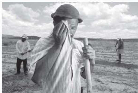
Figura 4 - Camponeses (Fonte: www.nead.org.br).

Ao estudar o camponês no Nordeste, FORMAN (1979), mostra que o trabalho camponês existiu paralelo ao regime de plantation . Essas unidades de produção eram formadas por pequenos sítios e, em parte, foram responsáveis pelo desenvolvimento do comércio interno colonial, assim