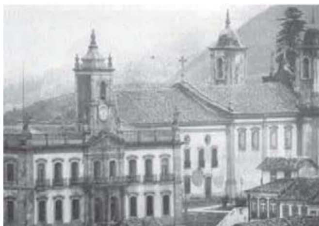
Figura 6 - Ouro Preto, antiga Vila Rica.

A economia mineira abriu um ciclo migratório, pois esta oferecia possibilidades de exploração para as pessoas de poucas condições, pois, não exigia altos investimentos na medida em que o ouro era encontrado no fundo dos regatos. Os exploradores na sua maioria, eram pessoas de pequena posse que sonhavam fazer fortuna no “novo eldorado”.