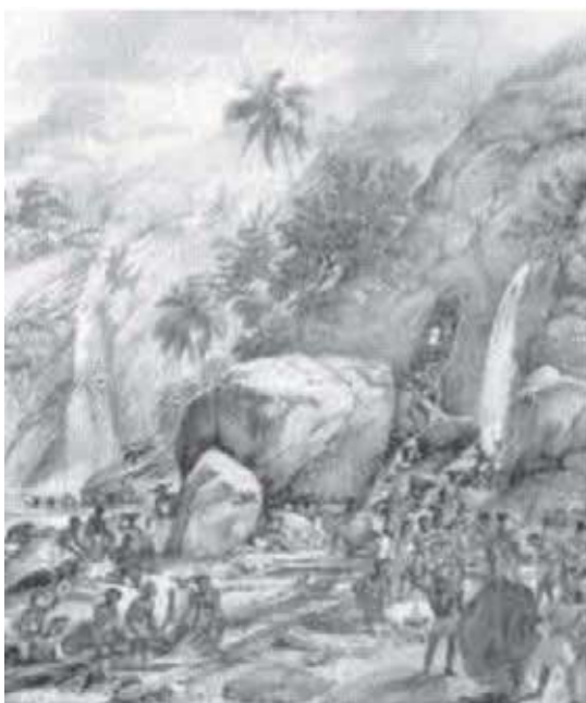
Figura 9 - Extração Aurífera.

- Salvador – Fornecia escravos, gado, mercadorias vindas da Europa (tecidos, ferramentas, sal, ferro etc.