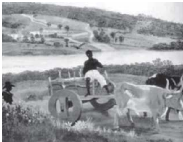
Figura 1 - Pecuária no Brasil colônia