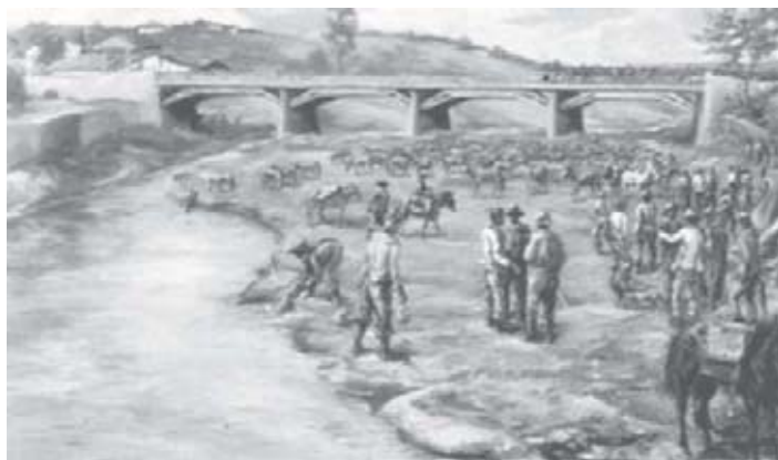
Figura 7 - Extração de ouro em Minas Gerais

garam a ser vendidos muito caro devido à enorme quantidade de ratos existentes nos arraiais auríferos... muitos índios se alimentando de bichos de taquara, que deviam ser atirados vivos a água fervendo, pois, uma vez mortos, eram veneno refinado (VERGUEIRO, 1981, p. 19).