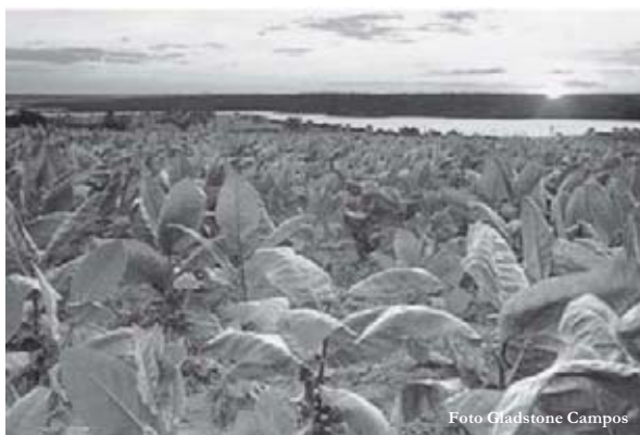
Figura 3 - O cultivo do fumo ainda se constitui em uma atividade econômica importante no Brasil atual (Fonte: www.gula.com.br ).

Era cultivado, principalmente, no Recôncavo baiano e na capitania de Pernambuco. Era um produto que, diferentemente do açúcar, era produzido principalmente em pequenas unidades de produção tendo como base o trabalho familiar. Jean Baptiste Nardi (1987) aponta três fases para o comércio do fumo no Brasil.