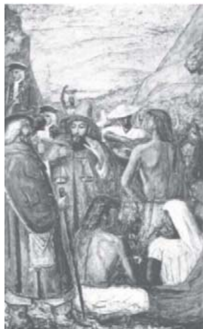
Figura 8 - Funcionários da Coroa arrecadando impostos.