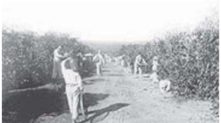
Figura 3 - Imigrantes italianos trabalhando na colheita do café.

A primeira experiência conhecida como Sistema de Parceria, coube a iniciativa do Senador Vergueiro que em 1852 transferiu para sua fazenda em Limeira oitenta famílias de camponeses. Nesse sistema o imigrante arcava com basicamente todas as despesas tais como: passagem, alimentação, ferramentas etc. Além disso, o colono assinava um contrato através do qual só