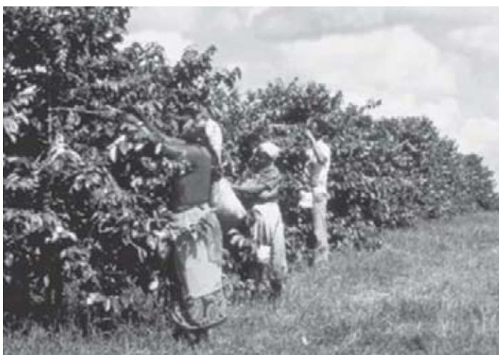
Figura 1 - Economia cafeeira.

Ter assimilado o conteúdo da aula anterior.