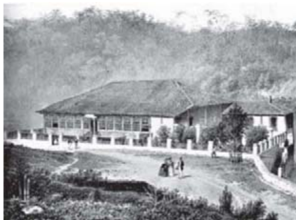
Figura 2 - Fazenda Produtora de Café no Vale do Paraíba.

As fases produtiva e comercial estavam rigorosamente isoladas, carecendo os homens que dirigiam a produção de qualquer perspectiva de conjunto (...) isolados os homens que dirigiam a produção não puderam desenvolver uma consciência clara de seus próprios interesses”. Enquanto a economia cafeeira, “desde o começo, sua vanguarda esteve formada por homens com experiência comercial (FURTADO, 1977, p. 114-115).