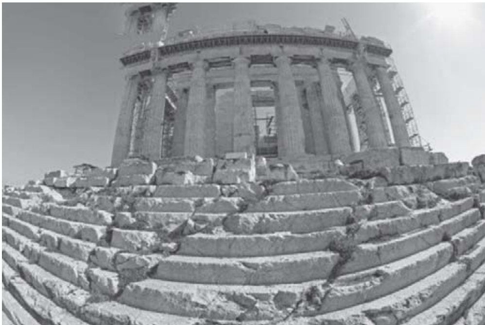
Arquitetura grega.

Antes de estudar o assunto desta aula reveja, no material didático disponível, a história da Grécia e de Roma, especialmente da parte cultural.