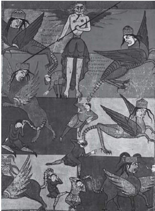
Satanás, no Apocalipse. São Severo (Fonte: Grandes personagens da história universal. v I - São Paulo: Abril Cultural, 1972, p. 238).

Por ser recente, creio que todos guardem na memória lembranças da passagem do ano de 1999 para o ano 2000, das comemorações, expectativas, previsões e, para muitos, do sentimento de temor e de incredulidade. Afinal, aquela foi uma virada de ano diferente das demais porque, junto com o fechamento de um século, vivíamos o início de um novo milênio.