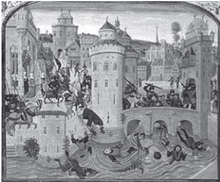
Revoltas camponesas na Idade Média.

No caso da Idade Média, a resposta pode se basear na contribuição do medievo para o surgimento de várias instituições básicas, idéias, valores e modos de vida que se tornaram hegemônicos no Mundo Ocidental, o qual inclui a América e o Brasil. Ou seja, o estudo e a compreensão das identidades nacionais implicam num retorno às suas origens nos séculos medievais.