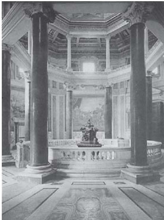
Batistério da Igreja de São João de Latrão, em Roma, datado da época do imperador Constantino.

Iniciaremos o presente capítulo revendo algumas questões relacionadas à crise do Império, com o propósito de acompanhar as transformações que se seguiram à ruína do mesmo, especialmente da sua parte ocidental. Com esse assunto iniciamos o estudo da chamada Alta Idade Média, período marcado primeiro pela regressão no que diz respeito à organização política e ao domínio cultural dos romanos, à qual se segue o aparecimento das condições para o crescimento que vai orientar a formação de um mundo novo.