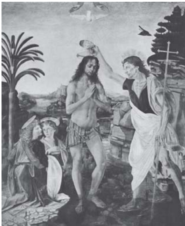
Batismo de Cristo, por Leonardo da Vinci.

identificar na crise do Império Romano as condições que favoreceram as invasões e o desaparecimento do Império Ocidental; relacionar o surgimento de uma nova ordem política, social econômica com a fusão de elementos da cultura romana com a dos bárbaros germânicos; acompanhar a formação de um novo mapa geopolítico do Ocidente europeu.