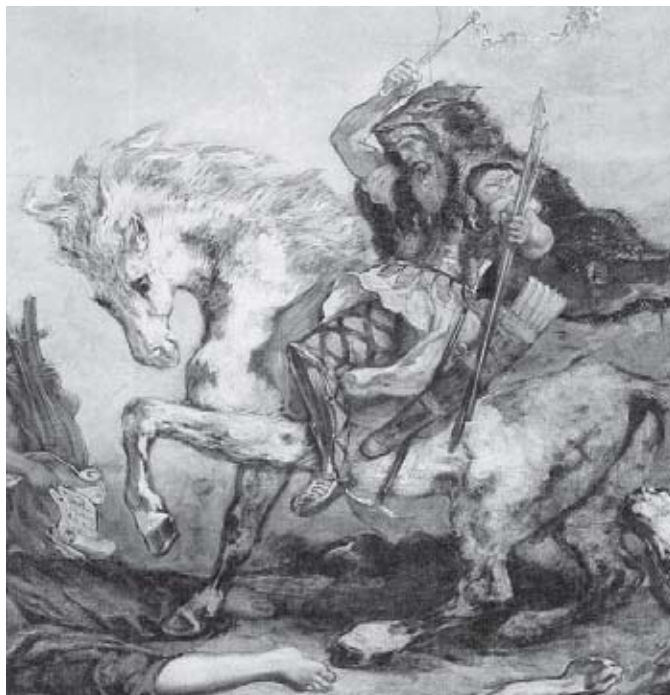
Átila, chefe dos hunos (434-453) (Fonte: Revista L' Histoire, n. 327, janeiro de 2008, p. 62).

Os hunos costumam ser conhecidos pelo seu rei Átila, chamado de o “flagelo dos deuses”. O depoimento abaixo sobre o aspecto e os costumes reforça a imagem de um povo rude e violento.