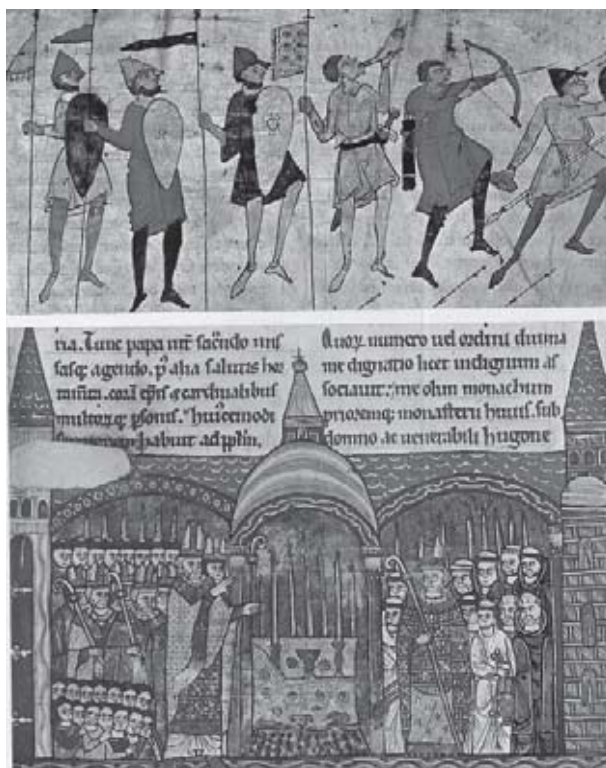
“A consagração do altar-mor da Abadia de Cluny, um centro de inconformismo”(Fonte: Grandes Personagens da História Universal. v. I, p. 243).

“Numa reação contra esse estado de coisas, a Igreja da Idade Média Central teve como objetivo buscar sua autonomia e sobretudo [...] tomar a direção de toda a sociedade. O primeiro passo em direção àquela dupla meta foi, em princípio do século X, a fundação do mosteiro Cluny, na Borgonha. O documento que criava a abadia já expressava a intenção de mantê-la livre de interferências, para que seus monges “nunca se submetam ao jugo de qualquer poder terreno.” No seu programa de submissão dos laicos aos clérigos, Cluny teve importante participação na elaboração da idéia da Trégua de Deus e de sua decorrência, a Guerra Santa.” (FRANCO JR, 1986, p. 115-116).