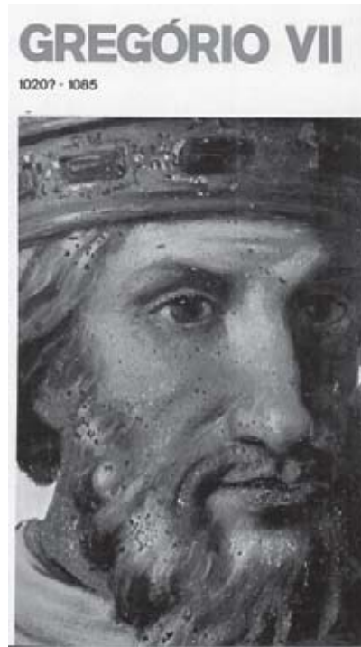
Gregório VII, idealizador da reforma da Igreja (Fonte: Grandes Personalidades da História Universal. v. I. p. 237).

“Importante dentro do espírito da Reforma Gregoriana foi a concepção das Cruzadas. Elas deveriam funcionar não só como um elemento de pacificação interna da Europa católica, mas especialmente como um fenômeno aglutinador da Cristandade sob o comendo da Igreja. Por isso acenava-se para seus participantes com a remissão dos pecados, a proteção eclesiástica sobre suas famílias e bens, a suspensão do pagamento de juros. Enfim, objetivava-se colocar a sociedade laica sob o controle da sociedade clerical, e alargar a área de atuação desta última pela submissão dos infiéis (Cruzadas no Oriente Médio e na Península Ibérica), dos cismáticos (Cruzada contra Bizâncio) e dos hereges (Cruzada contra os cátaros).” (FRANCO JR, 1986, p. 119).