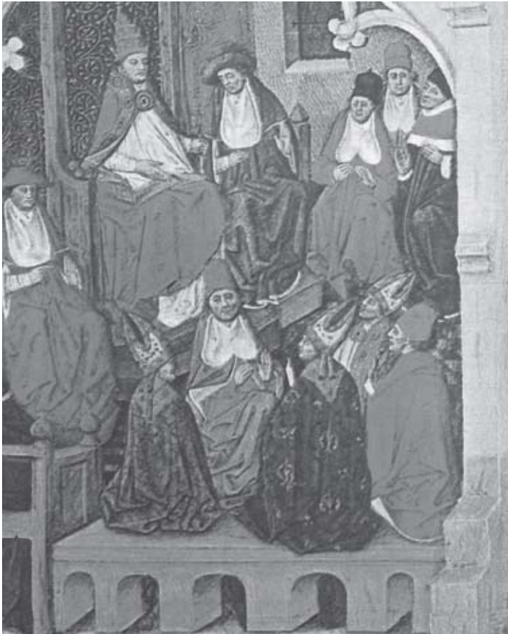
Concílio da Igreja realizado em 1095, em Clermont, loucou, pela 1ª vez, o apelo à retomada dos lugares sotos (Fonte: Grandes Personagens da História Universal. v. II. p. 276).

No século XI, a cristandade ocidental se expande através das Cruzadas, movimento desencadeador de significativas transformações ocorridas na Europa Ocidental.