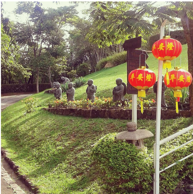
Estátuas dos pequenos Budas, no Templo Zulai (Cotia/SP)

We decided to visit a Buddhist temple and it was wonderful! It is located in the town of Cotia, in São Paulo. We walked around the place, and took many pictures. We saw beautiful statues and my favorites were "the little buddhas". There were many people visiting the temple.