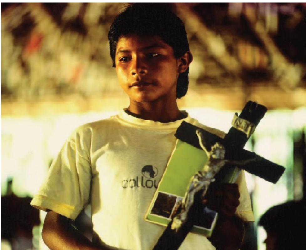
Culto religioso na Ilha de Camanaus - S. Gabriel da Cachoeira (AM). 1993.