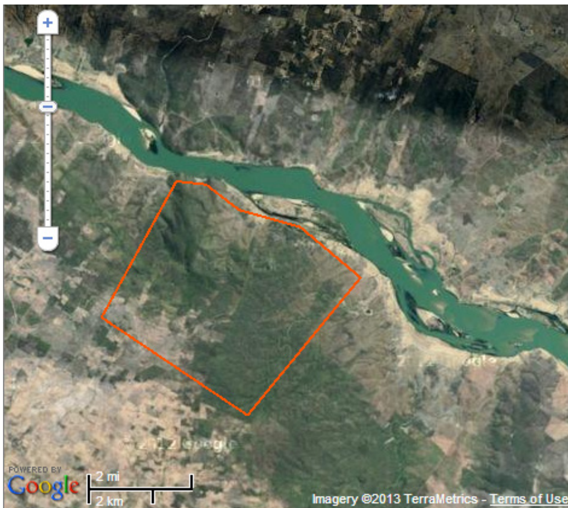
Terra dos índios Xokó: Caiçara e ilha de São Pedro.

O que está aqui resumido em poucas linhas, na verdade, não dá conta da intensa mobilização dos índios e seus aliados, do clima de violência e permanente tensão que enfrentavam na área, dos processos na justiça, da tramitação burocrática, de todo um emaranhado de ações e conflitos que a imprensa, de modo geral, foi registrando à medida que iam ocorrendo.