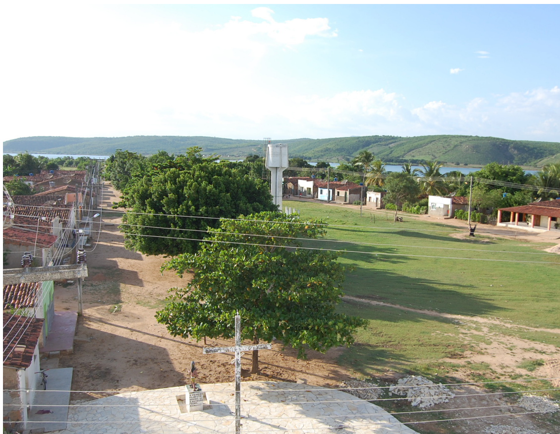
Aldeia dos índios Xokó - Ilha de São Pedro em Porto da Folha (SE). março de 2010.