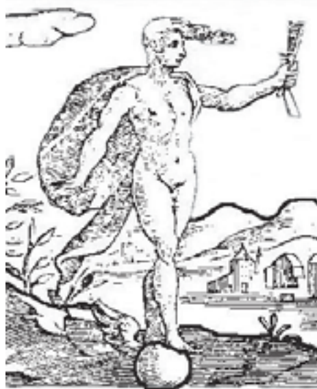
Imagem de Kairós.

Nesta aula, aprendemos que os sofistas dedicaram-se a estudar a linguagem e compreender seu poder sobre as almas humanas. Com seus estudos, os sofistas obtiveram riqueza, permitindo-lhes executarem obras públicas, e prestígio, assumindo cargos públicos de destaque para o auxílio de seus concidadãos. Não eram inimigos dos filósofos, mas seus adversários no plano das idéias. Górgias de Leontinos nos adverte quanto aos discursos falsos, fala da importância de se saber o momento oportuno de falar e calar e reflete sobre o poder do discurso poético.