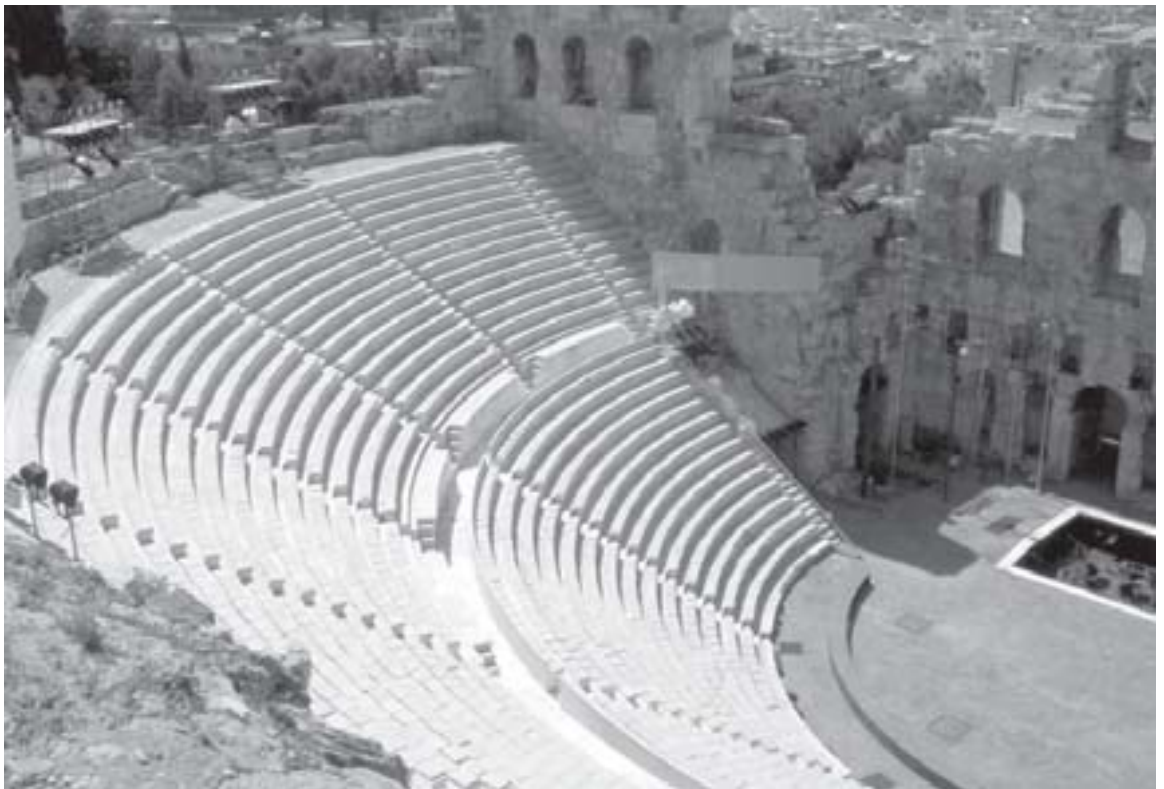
Teatro construído por Herodes Ático.

Orador ateniense (390/314 a.C.). Considerado um dos maiores oradores gregos da Antiguidade.