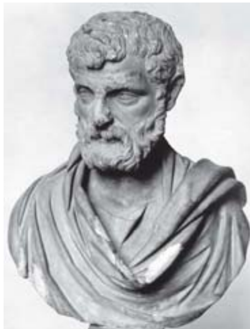
Busto de Herodes Ático.

Sofista grego, natural de Leontinos (483-375 a.C.).