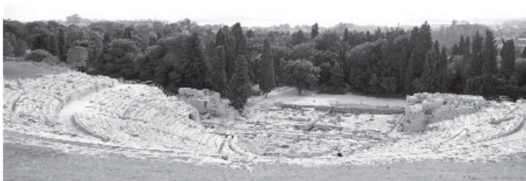
Teatro grego construído na Antigüidade e preservado até os dias de hoje. (Fonte: http://www.mikix.com ).

Houve, na Antigüidade, dois grandes movimentos sofísticos: um no período clássico* e outro, no período helenístico* . O primeiro movimento (a primeira sofística) tem como representantes Górgias de Leontinos, Protágoras de Abdera, Pródico de Céos, Trasímaco , Antífon e Hípias , entre outros. Essa sofística, na verdade uma “retórica filosofante”, como define Filostrato, distingue-se da Filosofia pelo modo de argumentação e de investigação. A segunda sofística