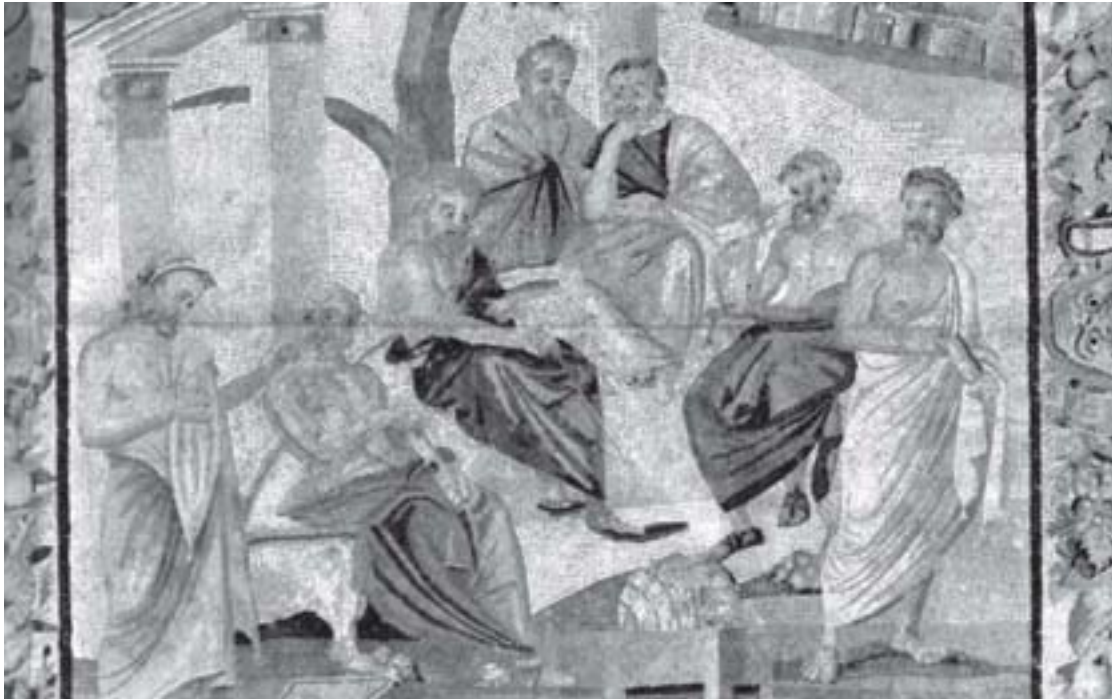
A Escola de Platão (Pintura de Feuerbach, 1869).

Sem dúvida, porque muitas vezes ou julgamos saber (e não sabemos na verdade) como obter algo que queremos, ou julgamos querer (e não queremos verdadeiramente) alguma coisa. Por essa razão, para Sócrates, ninguém erra por sua própria vontade. E isso porque, na realidade, nós sabemos bem pouco sobre nós mesmos: somos seres imperfeitos e limitados. Ora, se somos assim imperfeitos, da mesma forma será imperfeita nossa sabedoria. Assim, diz-nos Sócrates: “A sabedoria de todo homem é pouco ou nada comparada à sabedoria divina”. E será sábio justamente aquele homem que tomar plena ciência disso e não se achar detentor de uma sabedoria divina e perfeita. No momento em que o homem reconhece sua ignorância em relação à verdadeira sabedoria, é capaz de iniciar a busca por uma sabedoria de vida, e essa sabedoria será o conhecimento sobre o que é bom e o que é ruim para si.