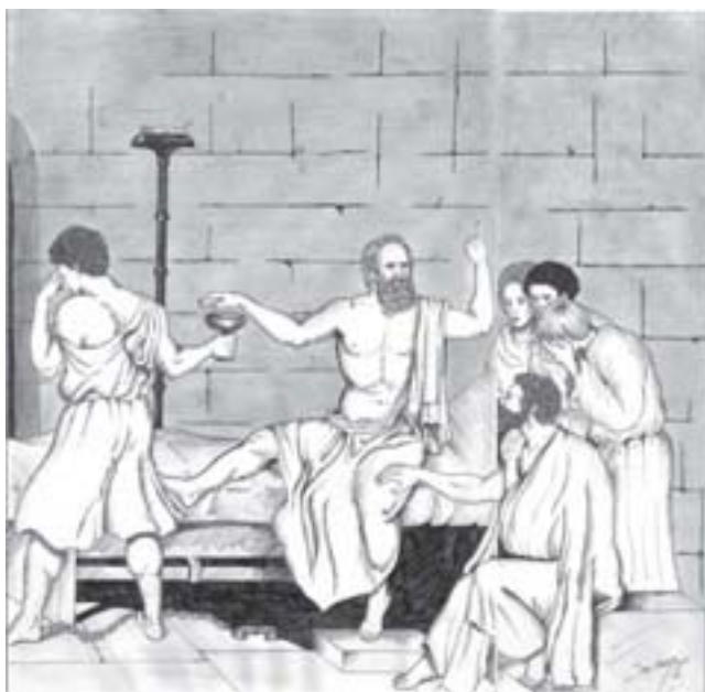
A morte de Sócrates.

conhecermo-nos a nós mesmos e, para isso, é preciso analisarmos todas as crenças recebidas em nossa educação. Esse exame de nossas crenças é um exercício crítico construtivo que tem como objetivo eliminar as falsas crenças que nos tornam infelizes. Sócrates dedicou sua vida a essa tarefa que ele entende como uma missão divina: comunicar aos homens a necessidade de avaliarem as próprias crenças e de se autoconhecerem.