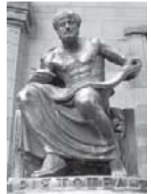
Estátua de Aristóteles no Museu de História Natural de Oxford, Inglaterra.

Na próxima aula, conheceremos algumas idéias da Filosofia Cínica, através de um de seus maiores nomes: Diógenes de Sínope, o “Cão”. E poderemos responder a perguntas tais, como: por que o Cinismo é uma Filosofia socrática? Em que sentido o Cinismo ultrapassa o pensamento do próprio Sócrates?