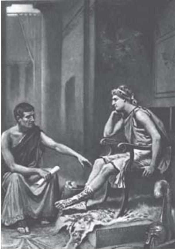
Aristóteles ensinando Alexandre, J L G Ferris, 1895.

2. Apelo à ignorância : é a afirmação de que é verdadeiro algo que não se provou ser falso. Quando uma pessoa acusa outra de algo, cabe ao acusador apontar as provas que determinam a culpabilidade do acusado, e não o contrário. Por exemplo: alguém é acusado de um crime, mas não pode provar que não esteve na cena do crime, não é necessariamente culpado, pois a falta de provas de que não estava na cena do crime não significa que ele estava na cena do crime. É preciso que o acusador prove que ele estava no local do crime e o praticou. Vejamos a razão disso num caso mais simples: suponha que alguém acredite em fadas; essa pessoa não poderá, para provar que as fadas existem, dizer que a prova disso é que ninguém conseguiu provar que elas não existem.