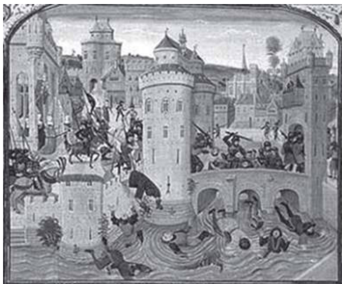
Revoltas camponesas na Idade Média.

No caso da Idade Média, a resposta pode se basear na contribuição do medievo para o surgimento de várias instituições básicas, idéias, valores e modos de vida que se tornaram hegemônicos no Mundo Ocidental, o qual inclui a América e o Brasil. Ou seja, o estudo e a compreensão das identidades nacionais implicam num retorno às suas origens nos séculos medievais.