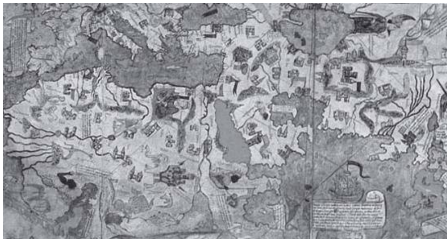
Mapa do início dos descobrimentos Marítimos (Fonte: Grandes personagens da história universal, v II, p. 489)

Os Descobrimentos, também se assentavam em bases medievais nas técnicas náuticas, na motivação e nas metas. E a Centralização Política, para o estudioso, “era a conclusão lógica de um objeto perseguido por inúmeros monarcas medievais”, da mesma forma que “o sentimento nacionalista, que fornecia o substrato psicológico necessário à concretização do poder monárquico centralizado, também era de origem medieval”. (FRANCO JÚNIOR, 1986, p. 171-172).