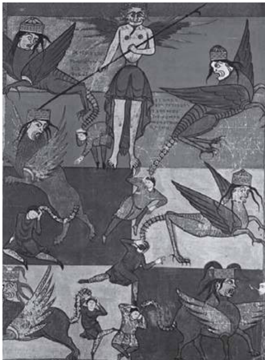
Satanás, no Apocalipse. São Severo (Fonte: Grandes personagens da história universal. v I - São Paulo: Abril Cultural, 1972, p. 238).

Por ser recente, creio que todos guardem na memória lembranças da passagem do ano de 1999 para o ano 2000, das comemorações, expectativas, previsões e, para muitos, do sentimento de temor e de incredulidade. Afinal, aquela foi uma virada de ano diferente das demais porque, junto com o fechamento de um século, vivíamos o início de um novo milênio.