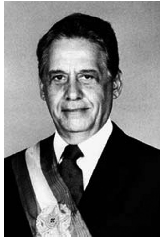
Fernando Henrique Cardoso

No que diz respeito à Educação, em seu Capítulo III, Seção I, que trata “Da Educação”, do Art. 205 ao 214, são estabelecidos os princípios gerais que deverão nortear a educação no Brasil. Apesar de a nova Carta Magna determinar em seu Art. 212 que: “A União aplicará, anualmente, nunca menos de 18% (dezoito), e os Estados, o Distrito Federal e os Municípios 25% (vinte e cinco por cento), no mínimo, da receita resultante de impostos, compreendida e proveniente de transferências, na manutenção e desenvolvimento do ensino”, no próprio ano de 1988 apenas 10,6% dos gastos da União haviam sido dedicados à Educação.