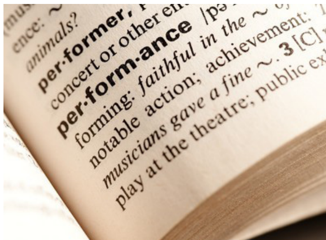
Tabela 2: Exemplos de palavras na língua inglesa e o word stress correspondente.