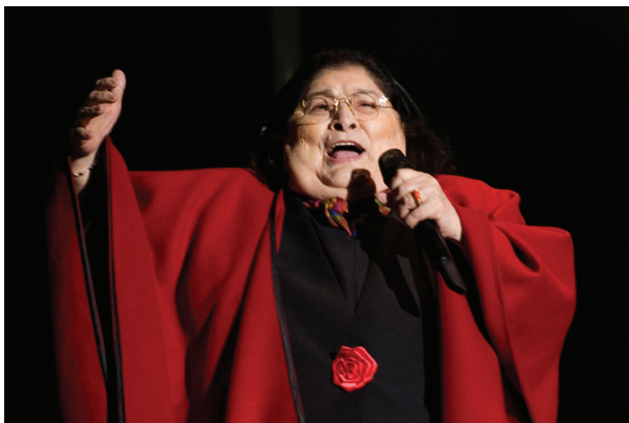
Mercedes Sosa en 2008, en Heredia (Costa Rica), en uno de sus últimos conciertos, con su tradicional poncho rojo, característico del noroeste argentino.

Haydée Mercedes Sosa, conocida como Mercedes Sosa nació en San Miguel de Tucumán, Argentina, el 9 de julio de 1935 y se puso conocida como La Negra Sosa o La Voz de América, fue una cantante de música folclórica argentina reconocida en América Latina y Europa. Mercedes Sosa comenzó a cantar en una época, en la que el tango de Buenos Aires, que era la música popular por excelencia, estaba siendo alcanzado en popularidad por la música de raíz folklórica, característica de las provincias, en un fenómeno que es conocido como el boom del folklore, producido de la mano de la industrialización del país y la migración de millones de personas del campo a las ciudades y de las provincias hacia Buenos Aires.