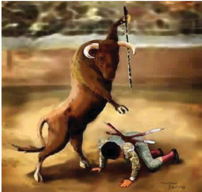
Toradas, disponible en: https://i.ytimg.com