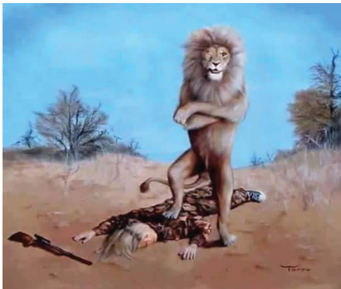
León Cazador, disponible en: http://guianetworkers.com