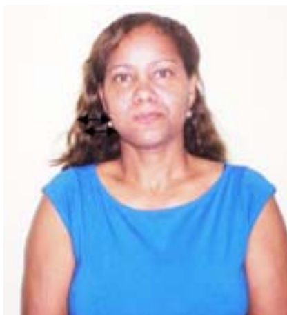
Ex.: ATO SEXUAL