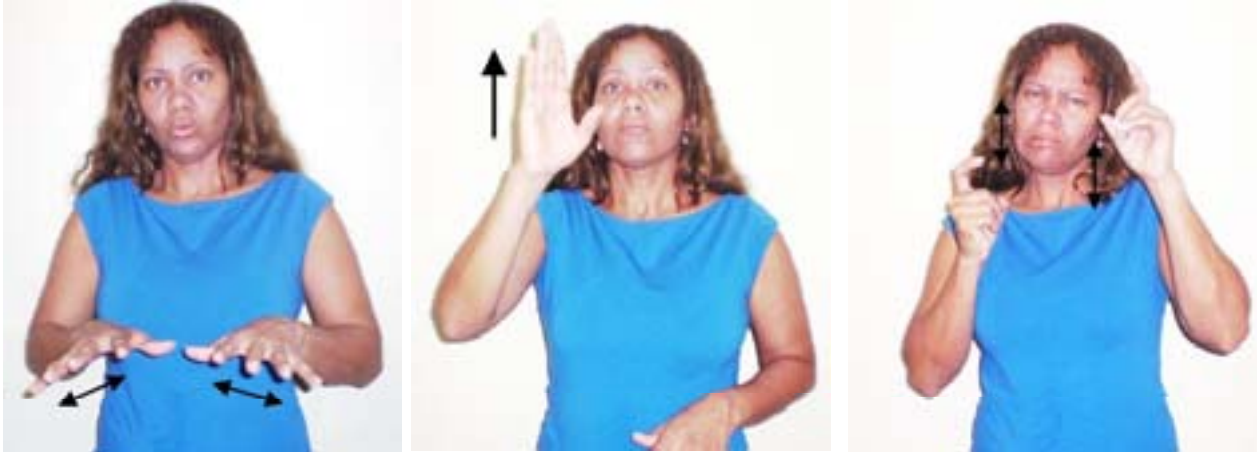
e) Expressão Facial e Corporal

A) configuração de mãos: refere-se às diversas formas que as mãos tomam na realização de um sinal (item lexical ou seja a palavra em LIBRAS ou de qualquer outra língua de sinais). Segundo Willian Stokoe, 1965 (apud QUADROS, 1997), foram registradas 43 configurações de mãos da Língua de Sinais Americana-ALS. De acordo com Felipe (2005), a LIBRAS possui 64 configurações das mãos, sendo que o alfabeto manual utiliza apenas 27 destas para representar as letras.