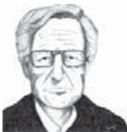
Avram Noam Chomsky

Uma das observações que devem ser feitas sobre as diferenças entre uma gramática descritiva e outra normativa é que, além do caráter prescritivo desta estar ausente daquela, a gramática descritiva não pode valer-se de critérios estéticos (bonito, elegante, fino etc), puristas ou quaisquer outros menos “científicos”. Uma gramática dizer, da forma mais objetiva possível, como é uma língua ou uma variedade, como é usada essa língua ou essa variedade.