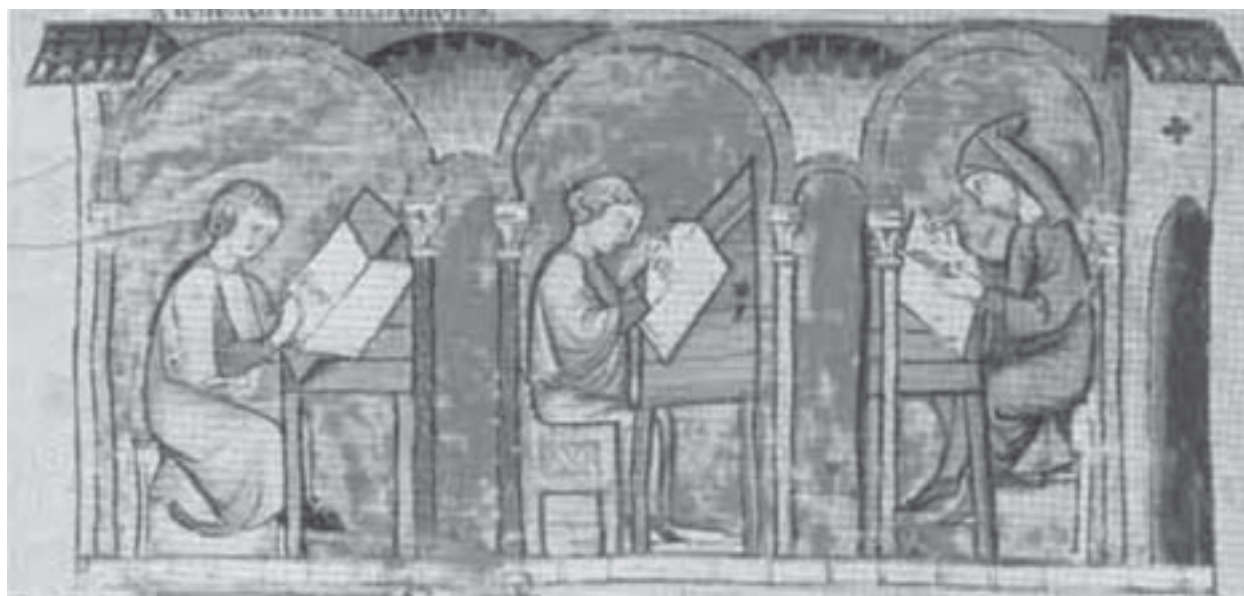
( http://guindo.pntic.mec.es ).

Por exemplo, a palavra “árvore” – o conceito que temos é o mesmo, mas se escreve diferentemente em cada língua.