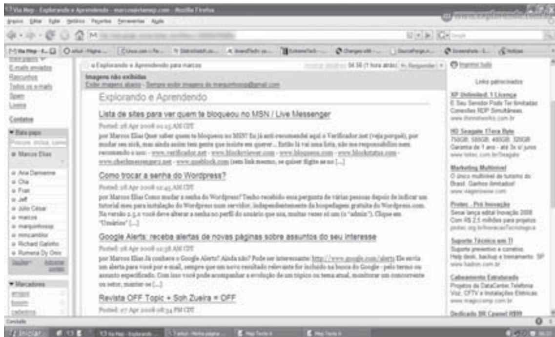
Página de um programa de E-mail - (Fonte: http://www.explorando.viamep.com ).