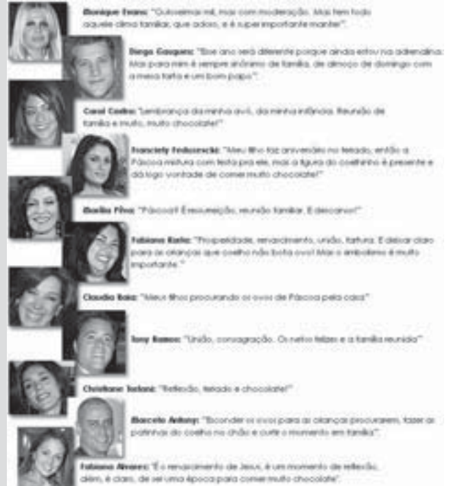
Frases sobre a páscoa de famosos (Fonte: http://diegoalemao.blogspot.com.br ).