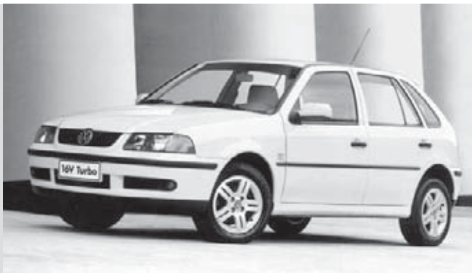
Volkswagen Gol 2001 (Fonte: http://www.lunaticfringe.org ).