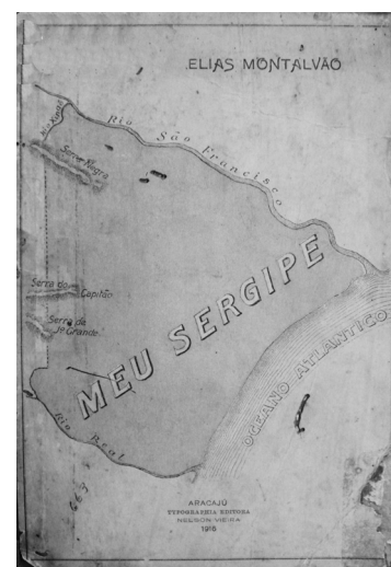
Capa do livro didático Meu Sergipe (1916), de Elias Montalvão.

O livro didático Meu Sergipe , elaborado por Elias Montalvão, em 1916, é aprovado por unanimidade pela Congregação da Escola Normal em sessão ordinária de 01 de outubro em 1914. A referida comissão considerou