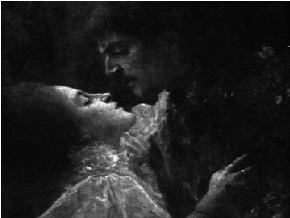
As raízes do romantismo.

Iniciaremos nossa aula abordando um pouco sobre o surgimento da estética romântica na Europa, mais precisamente nos países anglo-germânicos, vindo para o Brasil através da França e Portugal. A Revolução Industrial e a Revolução Francesa de 1789, com o advento da industrialização e o fim da aristocracia, tiveram papel marcante no aparecimento de uma estética que pregava o elogio do natural contra a razão, marca do Classicismo. Romântico vem de “romance”, no sentido de história interessante, pitoresca, fantástica, extravagante. Da palavra francesa roman , as línguas modernas derivaram o sentido corrente no século XVIII, e que penetrou no Romantismo, designando a literatura produzida à imagem dos “romances” medievais, fantasiosos pelos tipos e atmosfera, nos explica Afrânio Coutinho (1986).