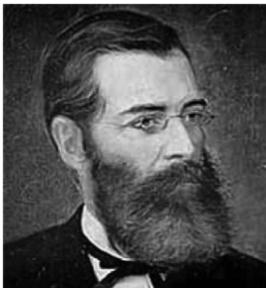
José de Alencar, “o patriarca do Romantismo”.

Alencar, o nosso maior romancista romântico, explica que este índio não era a cópia do índio real, mas o resultado de uma transfiguração que fazia desse índio um parente distante do cavaleiro português, pela sua lealdade e coragem. Vocês já devem ter ouvido falar do Peri, o grande herói do romance O Guarani , uma das obras primas de Alencar. Trata-se de um romance de aventura, em que o índio vence todos os obstáculos, salvando a Ceci da destruição total. Então, vocês já devem ter notado que o nosso Romantismo, embora herdeiro do Romantismo europeu, apresenta características próprias que o tornam diferente, isto é, mais brasileiro. Como já dissemos, o momento era de profundo antagonismo com Portugal, que estava explorando nossas riquezas e cerceando nossa liberdade.