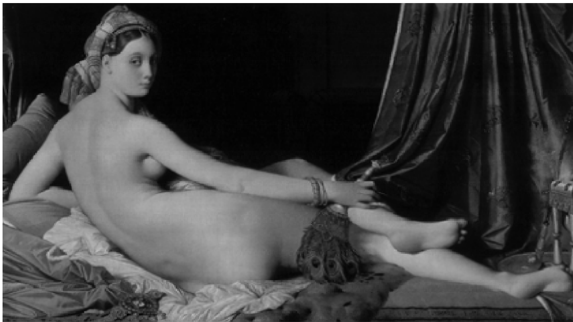
A estética romântica e a liberdade de criação.

Olá, tudo em ordem? Você já ouviu falar em Romantismo? Na aula anterior, tratamos de mostrar o Barroco e o Arcadismo – dois momentos estéticos bastante influenciados pela Península Ibérica (Portugal e Espanha) –, ressaltando alguns pontos comuns entre ambos e o Romantismo, um dos mais importantes movimentos literários que teve todas as qualidades de uma revolução, dando largas às manifestações do temperamento poético e literário nacionais. O Romantismo é, sem dúvida, ao lado do Modernismo, o mais importante momento literário no Brasil. E isto se deve ao fato de que é com ele que a literatura adquire sua autonomia, pois, até então, ela estava ligada, colonialmente, à literatura portuguesa, embora possuísse características brasileiras, conforme estudado na aula passada a partir do pensamento de Afrânio Coutinho (2008).