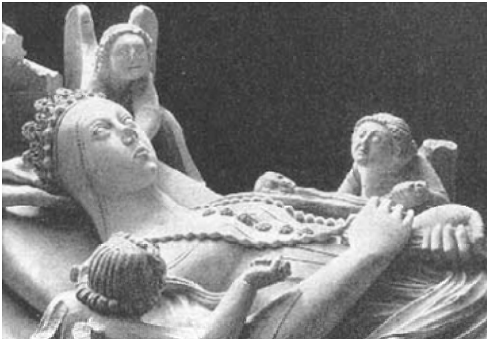
Monte de Inês de Castro