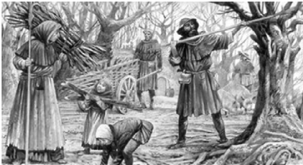
Trabalhadores medievais

Antes do desenvolvimento da técnica de Fernão Lopes, você já pôde acompanhar nas aulas anteriores que havia uma tradição historiográfica produzida na corte e nos mosteiros e a tradição oral. Dessa última, temos as novelas de cavalaria que foram reescritas e fundidas em diversas versões ao longo da Idade Média. Também podemos destacar as várias versões da Crônica Geral de 1344 , que narra a vida do patrono de Portugal, D. Afonso Henriques. Assim, Fernão Lopes não inicia do zero, pelo contrário, ele tinha à disposição uma variação de gêneros textuais que o antecederam. Cabe destacar que o Humanismo já estava a todo vapor na Europa, principalmente na Itália, com a leitura dos clássicos greco-romanos que até então eram lidos apenas nos mosteiros. Dessa concepção, podemos dizer que Fernão Lopes se aproxima pela valorização do homem, de sua realidade, do seu