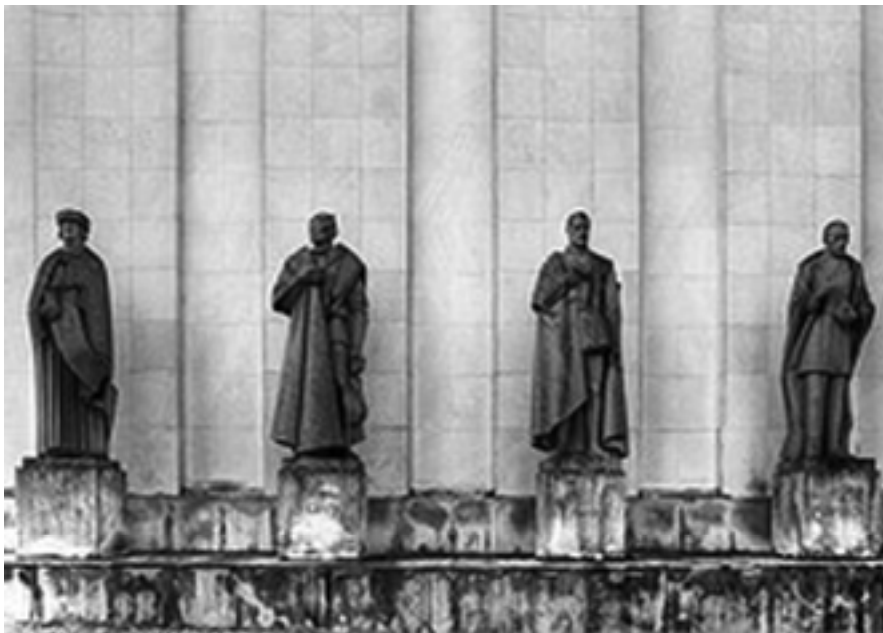
Estátuas dos Mestres da Literatura Portuguesa na Biblioteca Nacional de Portugal: Fernão Lopes, Gil Vicente, Luís de Camões e Eça de Queiroz.

História medieval portuguesa, poesia trovadoresca e cantigas de gesta.