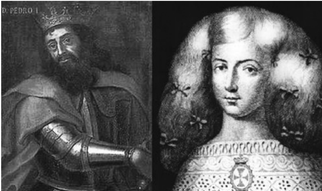
Dom Pedro e Inês