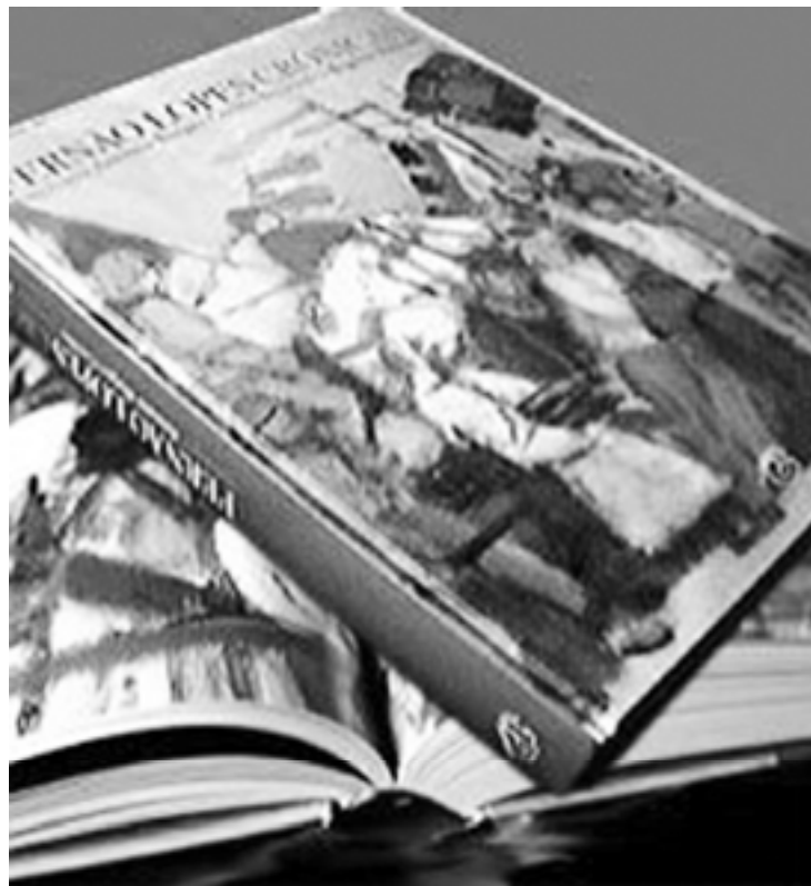
Esta obra constitui um importante documento e é considerado um legado da cultura medieval portuguesa.

As relações entre história e literatura estão presentes nas reflexões desta aula acerca dos prosadores de Avis: D. João I, D. Duarte e D. Pedro e das crônicas de Fernão Lopes. A prosa doutrinária da ínclita geração (infantes de Avis) tem um caráter mais pedagógico, pois funciona como um manual de bons comportamentos para os cavaleiros da corte. Já as crônicas de Fernão Lopes são consideradas referências para o estudo da história e da literatura portuguesa pela veracidade de suas fontes e pela qualidade de seu estilo. Então, dando continuidade aos estudos da literatura medieval portuguesa, esta aula aprofundará alguns debates em torno da historiografia e da prosa doutrinária dos infantes da dinastia de Avis. Você estudará o contexto histórico em que essa prosa foi escrita e suas principais características. Antes vamos situar algumas crônicas e livros de linhagens importantes que foram escritos por volta de 1344. Depois dessa retomada histórica, você conhecerá a prosa doutrinária de D. Duarte e a produção de Fernão Lopes, um historiador que chega ao posto de Cronista-mor na regência de D. Duarte em 1434. A fabulosa técnica usada por Fernão Lopes e sua busca da verdade dos fatos fazem dessas crônicas os textos mais importantes escritos no período medieval português.