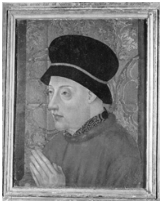
Dom João I