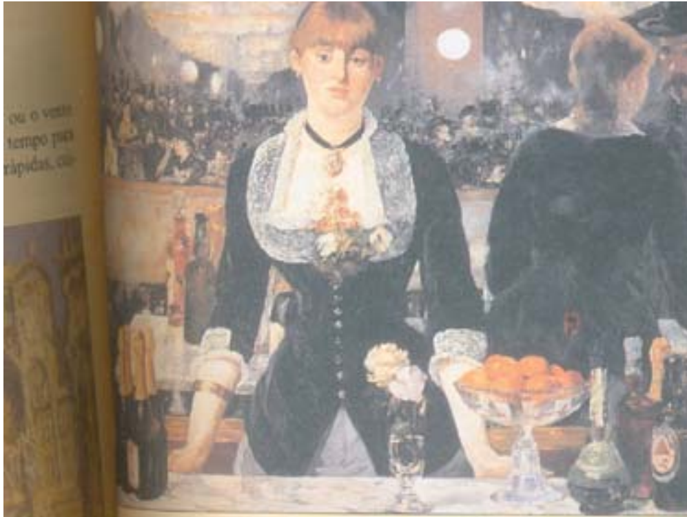
O Bar no Folies – Bergère, de Edouard Monet.

Observe agora o quadro abaixo, de Monet: