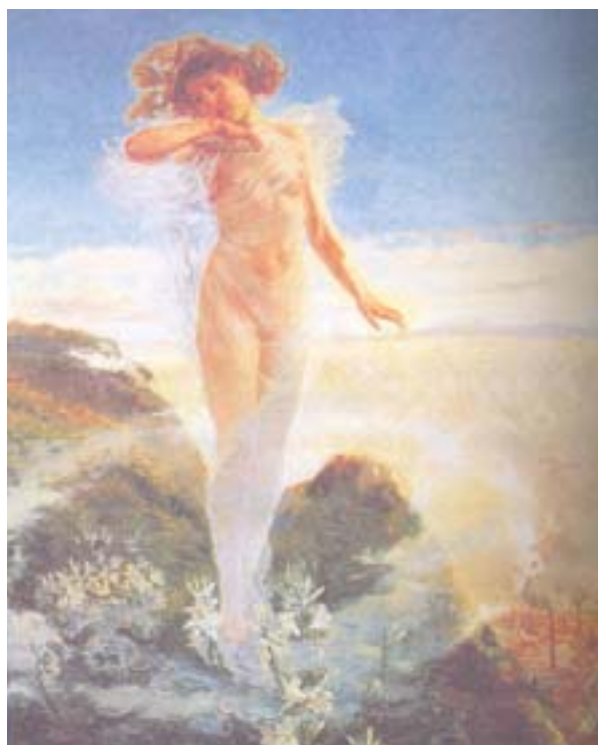
Perfume dos Campos, de Luciano Freire.

Observemos o seguinte quadro do pintor impressionista português Luciano Freire.