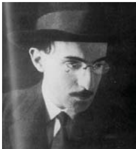
Fernando Pessoa – 1914.