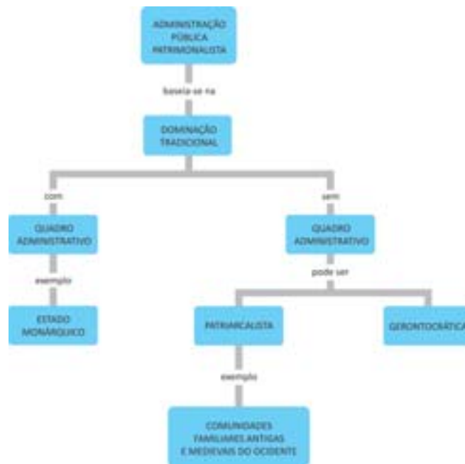
Figura 4: Estrutura da Administração Pública Patrimonialista

Para melhor visualizar este tipo de dominação tradicional assista o filme Elizabeth: a era de ouro . Veja alguns trechos desse filme no endereço eletrônico: < http://www.youtube.com/watch?v=rV9Q_R4Uu00 >.