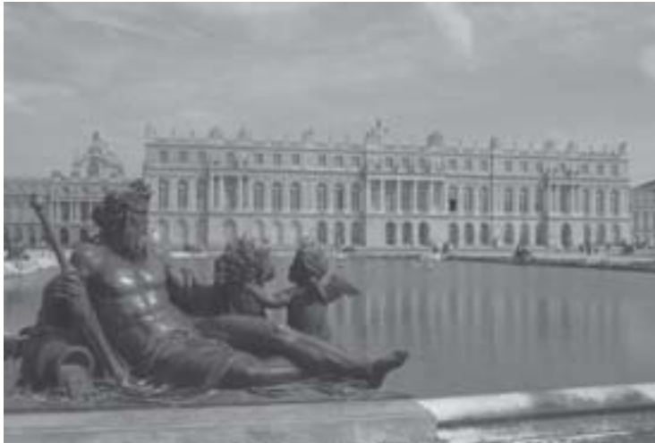
Figura 3: Palácio de Versailles

Fonte: < http://www.mariabuszek.com/kcai/101-80/IntroImages/Exam%201/versailles3.jpg >