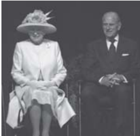
Figura 2: Rainha Elizabeth II e seu esposo o Príncipe Philip

Ainda segundo Weber (1984), quando aparece um quadro administrativo e até de cunho militar pessoal à disposição do senhor, temos a dominação tradicional do tipo patrimonial . Ela nos interessa em particular, pois dela chegamos, enfim, à Administração Pública Patrimonialista. No dizer de Matias-Pereira (2008), essa configuração patrimonial perdurou até a derrocada do Estado absolutista monárquico, em meados do século XVIII, caracterizado, principalmente, pela não separação entre os patrimônios pessoais do monarca e o público, pois todos os aparelhamentos estatais eram tomados como algo extensivo ao seu poder.