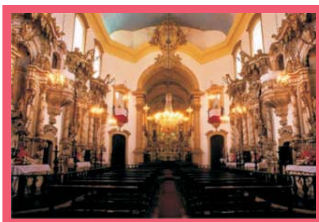
Figura 10: Igreja Nossa Senhora do Carmo, em Ouro Preto, é um dos símbolos do Barroco do século XVIII.