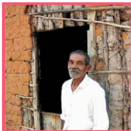
Figura 09: Quilombola.

Outra técnica de pesquisa muito utilizada nas investigações em geral e também na História, é o estudo de caso. Tal tipo de estudo individual permite aprofundar a compreensão sobre um dado processo sócio-histórico. Em geral, o uso do estudo de caso serve para o pesquisador que deseja realizar comparações, contextualizações e informa-