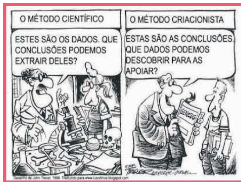
Figura 04: Charge métodos científicos