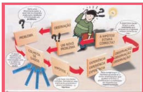
Figura 07: Método Científico.

Para auxiliá-lo no processo de construção de seu trabalho de pesquisa é importante considerar que a técnica é um instrumento específico inserido num método. Entretanto, a pesquisa em História tem exigido uma combinação de técnicas e métodos, visando dar conta de melhor analisar a complexidade da realidade social. Na figura 07, observe que há a lógica da pesquisa. Excluiremos apenas o item que lembra a experimentação, próprio