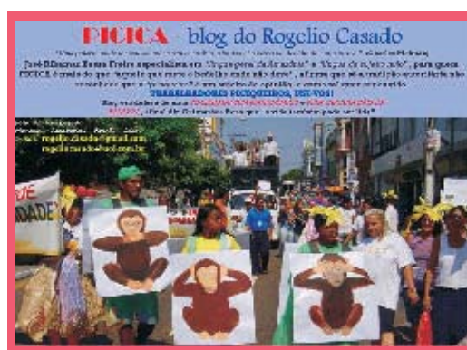
Figura 03: Passeata

entendemos que a realidade social é por natureza indescritível, imensurável e que as verdades são interpretações, que os olhares são diversos e que o historiador é marcado pela subjetividade, mesmo agindo de modo a alcançar a objetividade. Sendo assim, sabemos que por meio de métodos históricos podemos aproximar muito dessa realidade, mas não nutrimos o sonho/desejo de atingir a verdade dos fatos, pois que esta é inatingível em sua essência.