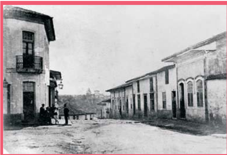
Figura 14: Ladeira do Ouvidor, 1860. São Paulo.

Exemplo 3: Fonte Imagética: fotografia, pintura, desenho, etc