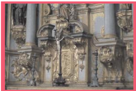
Figura 11: Interior de Igreja Barroca em Diamantina.