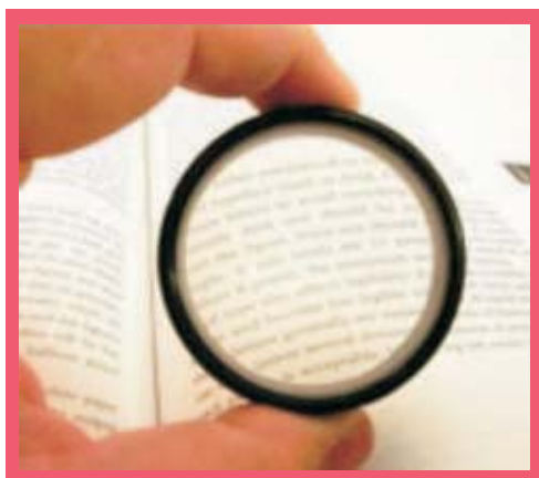
Figura 06: O historiador dispõe de certos meios científicos para alcançar conhecimentos e, além disso, se serve de certa sistematização, ou seja, põe em ordem os resultados obtidos pela pesquisa.

Em geral definimos a pesquisa documental como sendo aquela que utilizará documentos que, para o historiador, constituem as fontes de seu estudo, as pistas e os indícios pelos quais vai perseguir as respostas para suas indagações. Você já visitou arquivos municipais e estaduais, igrejas, museus, sindicatos e bibliotecas públicas? Nesses locais encontramos diversos documentos que podem ser analisados. Tais documentos estão inseridos em determinados contextos e fornecem informações sobre o mesmo, sendo, portanto, de suma importância para o historiador.