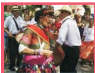
Figura 12: Festejo Popular

Debata sobre esse assunto com os seus colegas e com o professor, num chat criado por este.