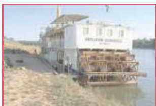
Figura 13: Barco à vapor