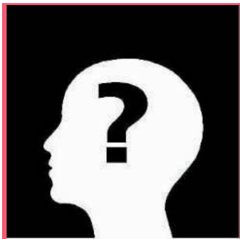
Figura 01: Teremos nós chegado ao ponto de tudo o que temos para dizer ter já sido dito?

Você deve estar se perguntando qual o motivo de falar de uma disciplina que sequer foi vista e que pertence ao sexto módulo. Podemos responder a você que as disciplinas do seu curso estão todas interligadas e não seria diferente com Métodos e Técnicas de Pesquisa.