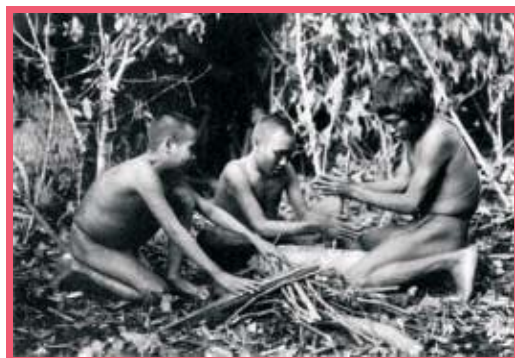
Figura 08: Índios botocudos, 1909.

O estudo de campo tem a vantagem de contribuir para os estudos históricos em profundidade. O termo “campo” é utilizado no sentido de que é o escopo da pesquisa e não apenas um lugar geográfico. Tais estudos são marcados pela flexibilidade, exigindo reformulação, sempre que necessária, dos pressupostos da pesquisa, dos objetivos e de suas hipóteses ao longo da mesma. Ao utilizar essa técnica, você terá que realizar a observação direta