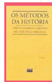
Figura 05: Capa do Livro Os Métodos da História

A obra “Os métodos da História” escrita por Ciro Flamarion Cardoso e Héctor Pérez Brignoli, aborda a evolução recente da ciência histórica a partir do caminho percorrido pela história linear dos fatos singulares à história das estruturas, as linhas de força da evolução recente, a história quantificada e suas correntes e a ciência histórica no presente. Em seguida trata da evolução recente a partir dos limites da quantificação e da econometria retrospectiva, dos limites entre história econômica e história total, os historiadores e as estruturas e a metodologia e dependência cultural. Logo após versa sobre Marxismo e história no século XX, a partir da concepção marxista da história da década de 20 até o momento presente, a influencia do marxismo no pensamento histórico contemporâneo e em relação à história da América Latina. Depois traz a história social, os sentidos dessa expressão, os dados econômicos, estrutura social e estratificação, movimentos e lutas sociais e as mentalidades coletivas. Em seguida, o método comparativo na História, a definição, importância e vantagens. Armadilhas e perigos na aplicação do método, precauções necessárias, as formas e os resultados da aplicação do método comparativo.