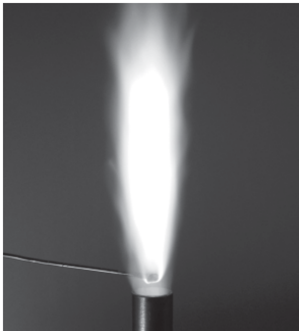
Chama do sódio.

Conhecimentos de estrutura atômica e propriedades atômicas.