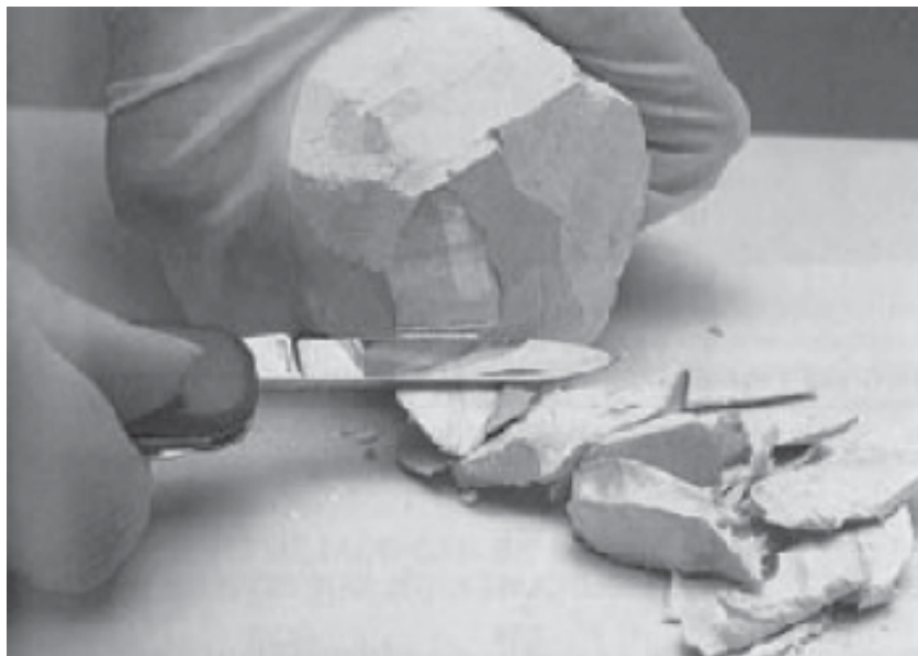
Figura 1: O brilho característico dos metais é mostrado com o sódio metálico.

Iniciaremos nessa aula as atividades experimentais, recomendo que antes de cada atividade experimental estudem os tópicos que são comumente chamados de química descritiva - que é a descrição da preparação, das propriedades e das aplicações dos elementos e seus compostos. Os elementos metálicos são os mais numerosos entre os elementos. Suas propriedades químicas são da maior importância para a indústria e a pesquisa contemporânea. Veremos muitas tendências sistemáticas nas propriedades dos metais em cada um dos blocos da tabela periódica, e algumas notáveis diferenças entre eles. A maioria dos metais possui condutividades elétricas e térmicas elevadas, são maleáveis, dúcteis e apresentam brilho característico (veremos nas aulas posteriores maiores detalhes sobre os metais) (Figura 1).