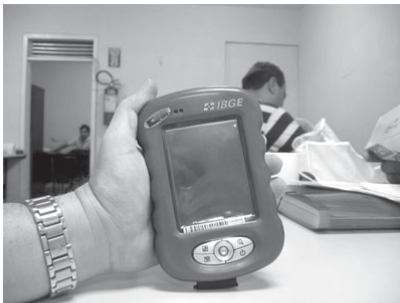
PalmTos utilizado no Censo.

Vejamos alguns desafios da pesquisa empírica em sociologia.