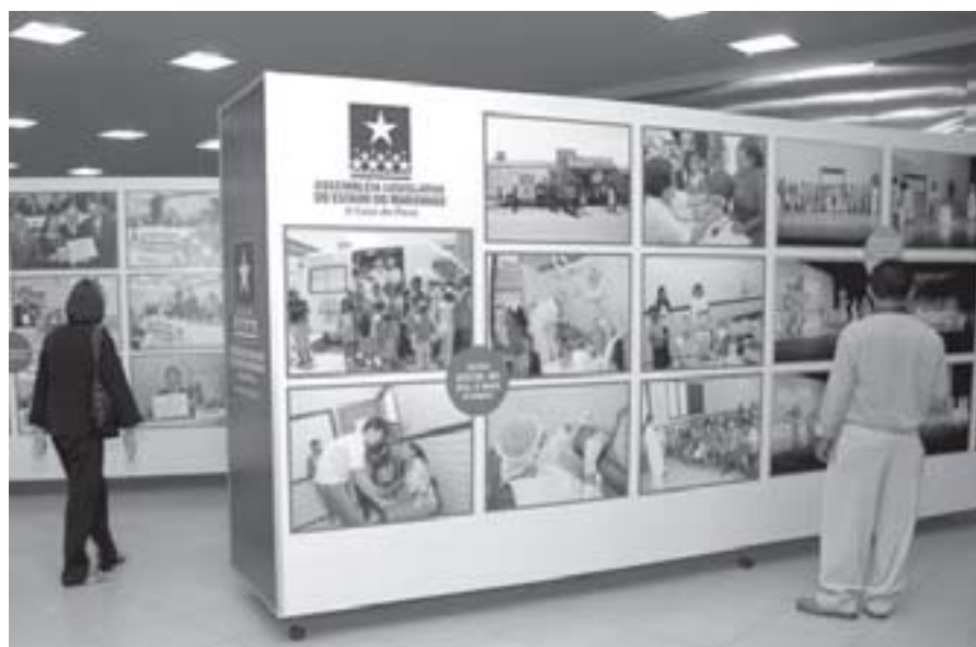
Pessoas observando exposição fotográfica (Fonte: http://www.al.ma.gov.br ).

Teorias – afirmamos, anteriormente, que outra estratégia de pesquisa muito comum em Sociologia é o que chamamos de pesquisa teórica. Nesse caso, o pesquisador não se envolverá com a análise de universos empíricos, mas com as construções teórico-metodológicas dele próprio e de outros sociólogos. Essa área de pesquisa é explorada, geralmente, por quem tem maior experiência profissional, pois requer uma familiaridade significativa com a tradição teórica da disciplina. Aqui, serão analisados conceitos e métodos